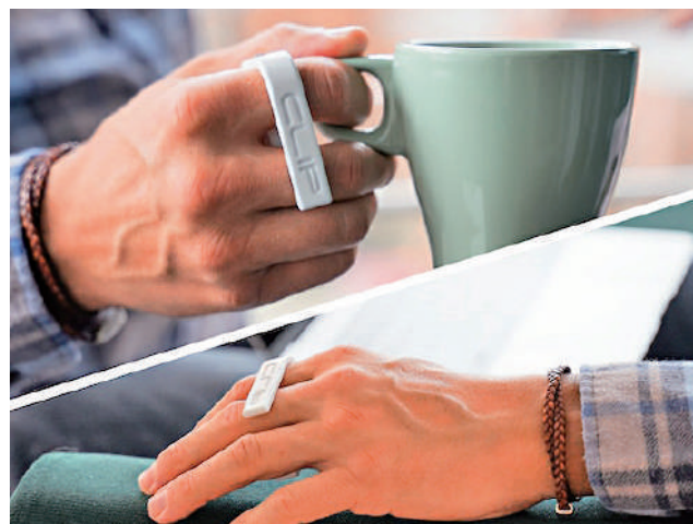
▲ 夾住食指和中指即可操控Clip Mouse，簡單易用。