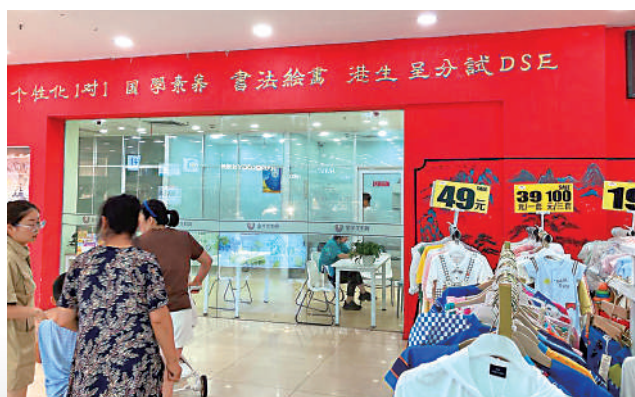
▲ DSE 的課程及考試深受內地學生熱捧。

在內地修讀DSE的學生，有可能會成爲一支生力軍，這對香港本地土生土長的學生來說，競爭很大，「港孩」如果不努力，與內地環境長大的港人子弟相比，恐怕會輸蝕好多。