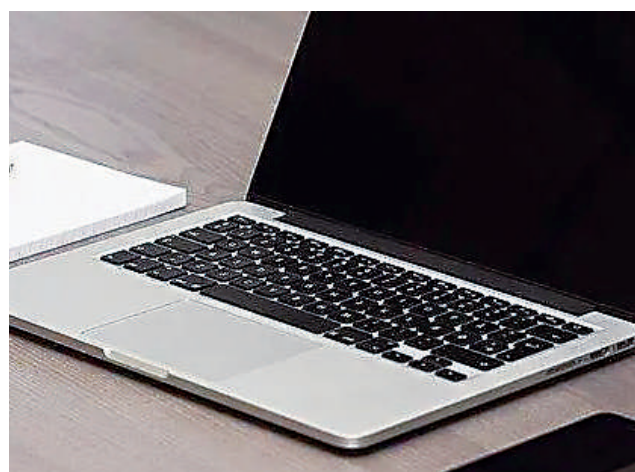
▲ 明年起，所有Chromebook作業系統電腦可獲十年自動定期更新。