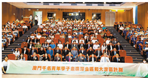
▲一眾嘉賓和學生參加「澳門千名青年學子走進深合區和大灣區計劃」啟動儀式。

據了解，此計劃除組織青年學生實地了解深合區和大灣區建設發展外，還將安排青年學生赴知名企業考察學習，並邀請在深合區和大灣區發展的澳門青年代表分享經驗、交流體會，幫助有意赴深合區和大灣區的澳門青年有更清晰直觀的感受及做好相應準備。