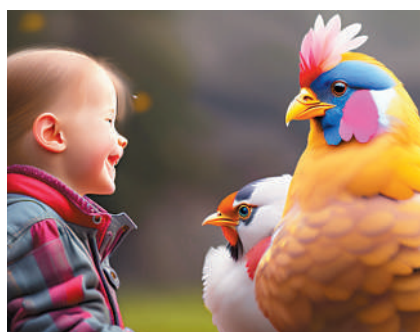
▲AI技術一日千里，只要聽到雞的咯咯叫聲，便能識別牠的情緒。

智慧化的轉型。他深信，只有真正了解動物感受，人類才能為牠們創建一個更加和諧、美好的生活環境。