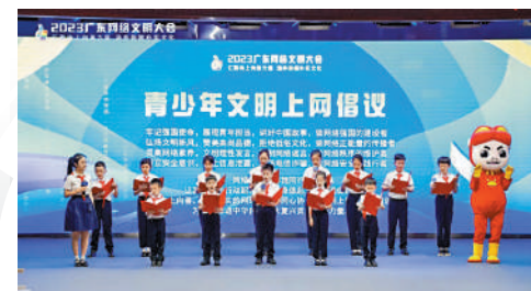
▲學生代表在互聯網大會共同宣讀青少年文明上網倡議。

學生代表們還共同宣讀了青少年文明上網倡議，承諾「做網絡強國的建設者，做網絡正能量的傳播者，做網絡秩序的維護者，做網絡安全的踐行者」。