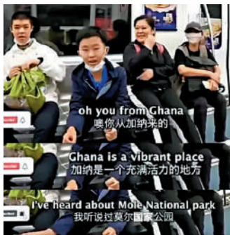
▲深圳一名小六生在地鐵與加納博主英語流利交談，令人讚嘆。