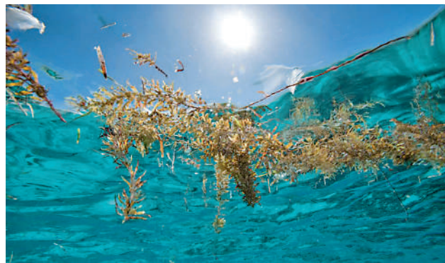
▲馬尾藻海整個海面飄滿海藻，魚類和動物幾乎絕跡，令海水異常清澈。

月，多個國家更是成立了保護組織，聯合保護並治理馬尾藻海。希望在新的時代，這片美麗海域，不會再成為另一種「海上墳地」。