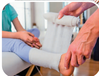
▲孩子骨折的護理必須小心，否則會令傷勢加劇，導致骨骼生長畸形。