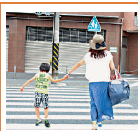
▲孩子牽着家長的手走路時「蹦蹦跳跳」，倘不慎跌倒，成人出於保護的本能猛力拉扯，便可能引發孩子肘關節的半脫位。

因此，家長在面對孩子可能發生的骨折或脫臼等意外時，必須保持高度警覺性和細心觀察，及時察覺孩子的異常表現，並鼓勵孩子勇敢表達自己的感受。同時，也要掌握一定的急救知識和技能，以便在緊急情況下能夠迅速、正確地應對。