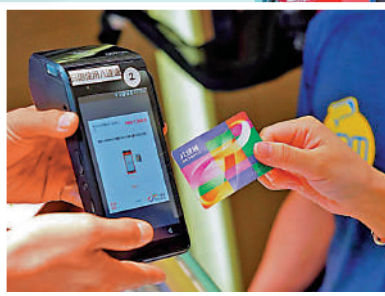
▲八達通將推出新的收款機，商戶可自行錄製拍卡的聲音。

八達通表示，正積極研究將跨境支付服務擴展至日本，港人日後可用八達通App掃描日本商戶的支付平台二