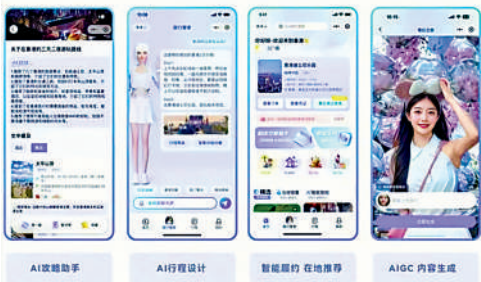
▲AI會提供行程設計和一站式購買旅遊產品等服務，讓顧客可輕輕鬆鬆去旅行。

據了解，在落地應用上，視旅VtripGPT的AI旅遊原生用戶產品，以及其端到端目的地智能運營系統已覆蓋香港、新加坡、四川、雲南等十多個境內外目的地。