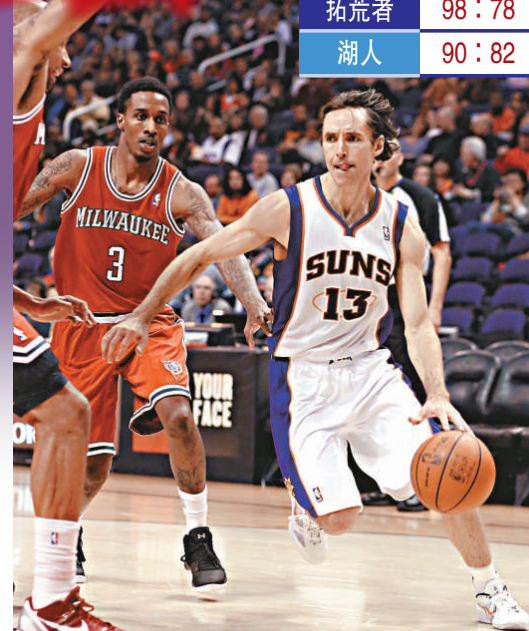
▲拿殊(右)在比賽中如入無人之境