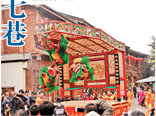
▲寧德霍童線獅又稱「抽獅」，現留存於福建寧德霍童鎮，是一種喬裝動物的雜技節目

「2012福建非遺進三坊七巷活動」第一階段的展覽展示將延續到元宵後，期間水榭「非遺」大戲台將在周末和春節假期連續進行。福建省「非遺」博覽苑的各項展覽展示活動將持續到三月份。