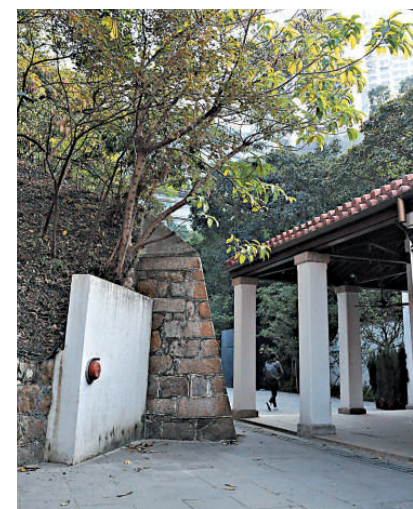
▲會議室外白牆上的紅色警鈴是舊時代的見證

二月九日，改建後的軍火庫舊址將面向公眾開放。查詢可瀏覽 www.asiasociety.org 。