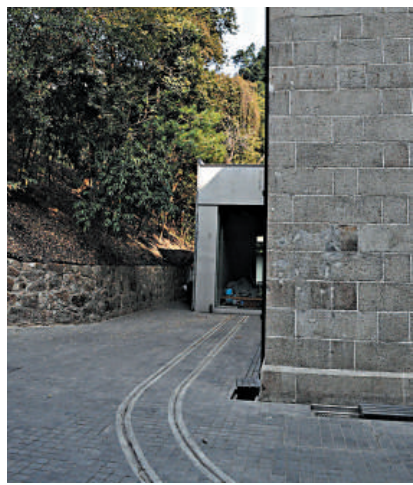
▲當年運火藥路軌通往的軍火庫A，如今改建為展覽館

陳啓宗熱衷古蹟保護及修復，曾花費十七年時間修復北京故宮博物院內兩處皇家花園。在昨日下午亞洲協會香港中心記者會上，陳啓宗既講了耗費四億元修復軍火庫的種種不易，