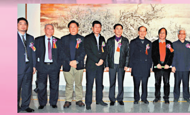
▲眾嘉賓在畫展上合影