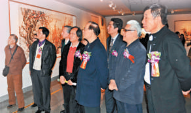
魯秋陪同領導嘉賓參觀展覽