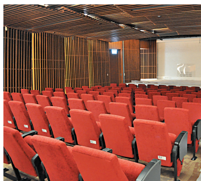
▲軍火庫B改為可容納一百餘人的劇場