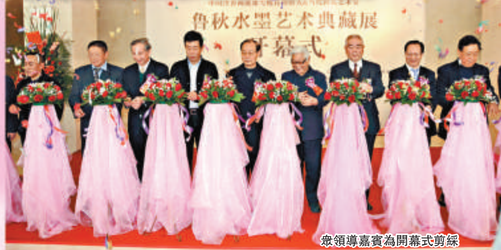
▲眾領導嘉賓為開幕式剪綵