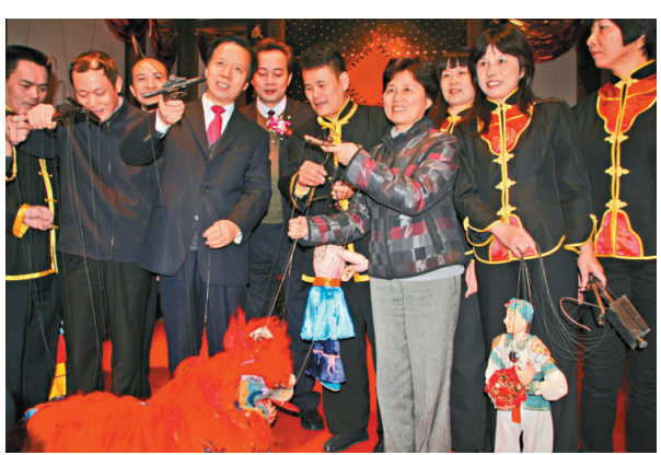
▲文化部副部長王文章(左四)與福建省副省長陳樺(右四)等觀看完木偶表演後，學習操作金獅木偶

【本報訊】記者蔣煌基福州報導：福建省文化廳廳長陳秋平日前表示，閩省文化廳與福州將立足福建深厚的非物質文化遺產資源，制定全省「非遺」項目進入三坊七巷的長效機制，致力於把三坊七巷建設成獨具特色的福建非物質文化遺產生態博物館。