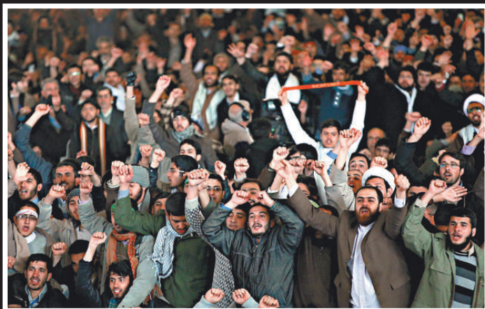
▲周五在德黑蘭大學聚集的群眾高喊口號，稱不會向國際壓力屈服放棄核計劃