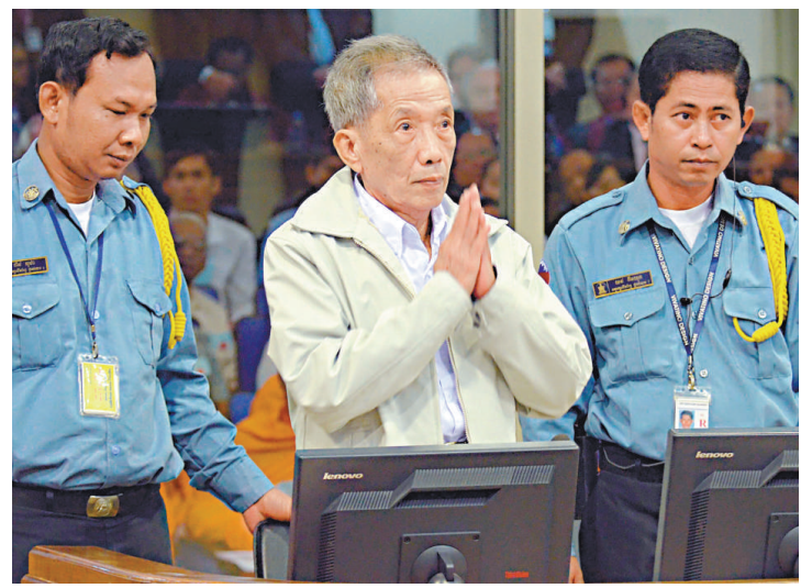
▲前紅色高棉S21監獄長康克由正在接受審訊