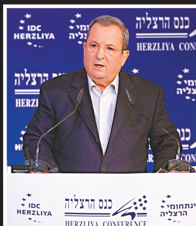
▲以國防部長巴拉克周四就安全政策和政策問題發表講話