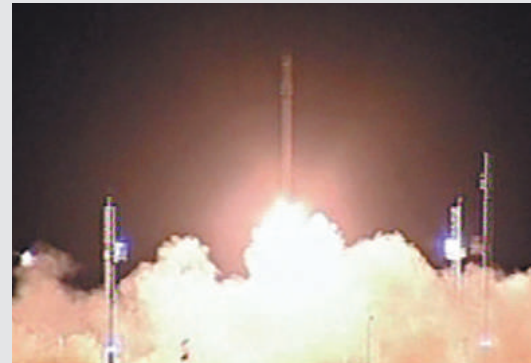
▲伊朗發射「納維德」觀測衛星

■伊朗3日宣布成功發射一枚觀測衛星「納維德」，這顆衛星將在距離地面250至370公里之間的軌道上運行。