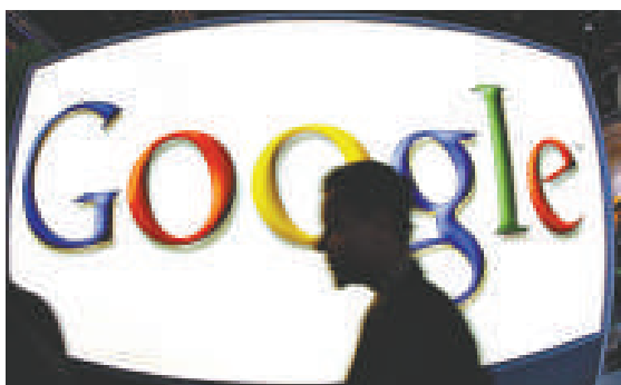
▲谷歌欲重返中國市場 資料圖片

【本報訊】據《華爾街日報》3日報導：全球最大互聯網搜尋器谷歌在旗下博客平台修改規定，針對需要審查內容的國家刪走敏感內容。與此同時，中國官方宣布，谷歌在中國合資公司的互聯網地圖服務目前可維持現狀。這顯示，中國官方和谷歌在互聯網地圖服務上的爭執有所緩和。