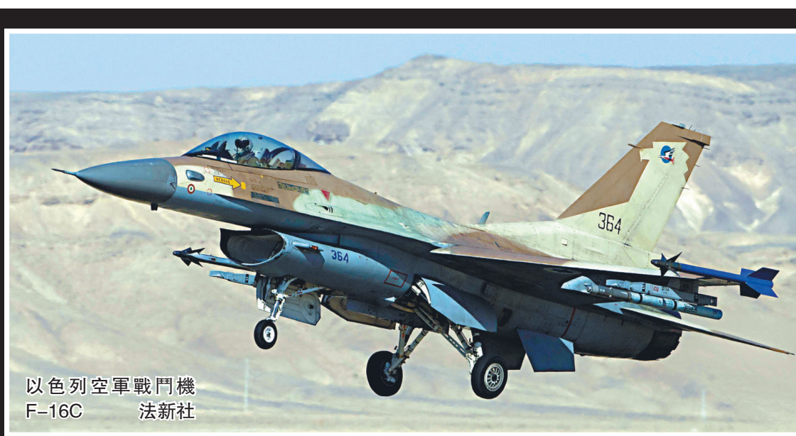
以色列空軍戰鬥機 F-16C

針對以色列的潛在戰爭威脅，伊朗方面周五做出回應。伊朗最高領袖哈梅內伊表示：「伊朗會在適當的時候用我們的威脅來應對石油禁運和戰爭可能。」