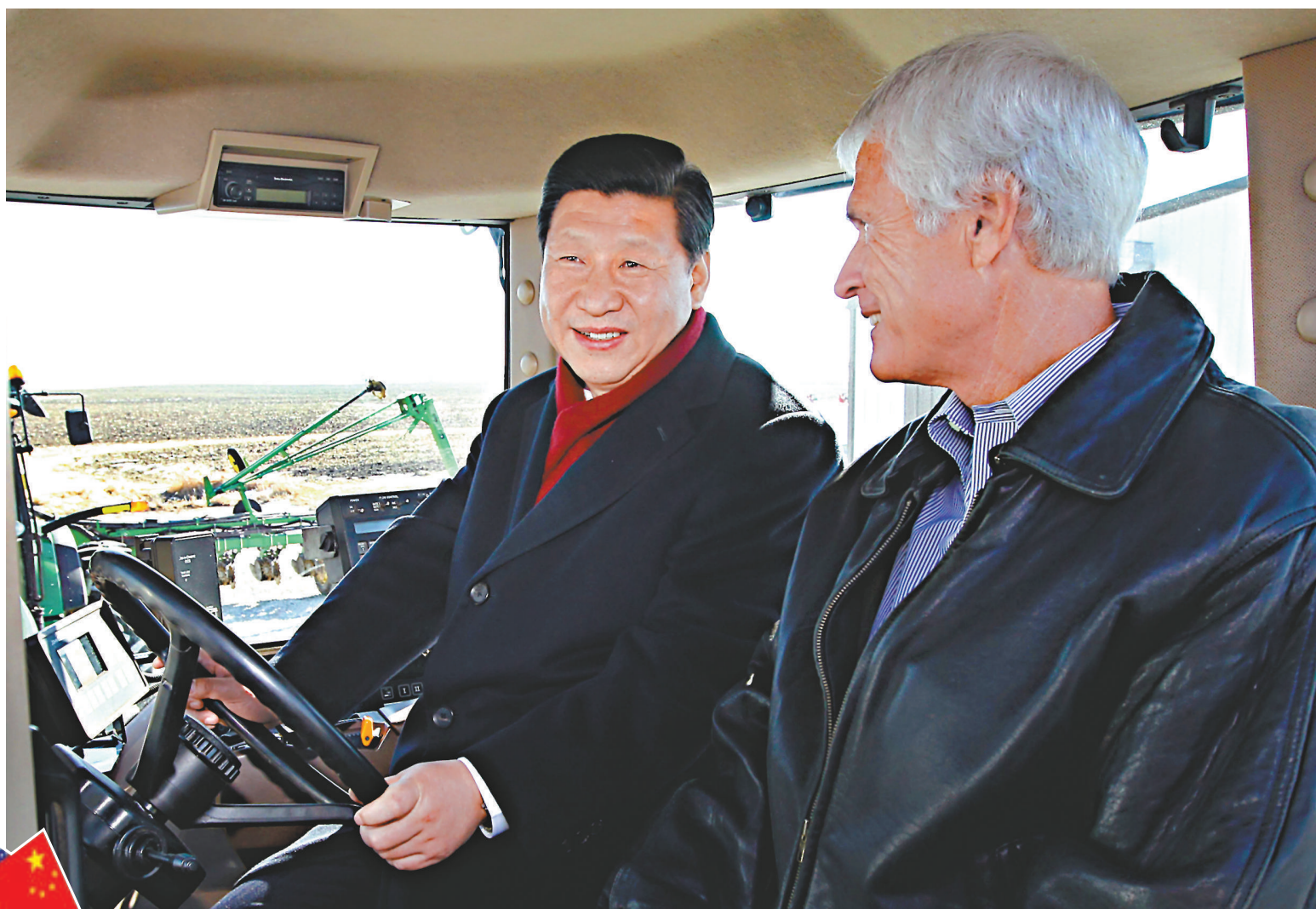
◀▶16日，習近平在美國得梅因金伯利農場參觀。左圖是習近平在農場主金伯利的陪同下操作其農用機械。

外交部長楊潔篪等陪同人員以及來自中美兩國150多位農業部門官員和專家學者參加研討會。