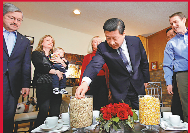
▲習近平在金伯利農場拿起那裡產出的大豆和玉米觀看。

習近平表示，美國地廣人稀，農業種植面積大，適合規模化經營生產，農業機械化、專業化、一體化程度都比較高。中美兩國農業互補性強。本世紀頭10年，中美農產品貿易年平均增幅超過20%。現在中國已穩定地推動了13.4億人口的吃飯問題，同時也是美國農產品第一大出口市場。兩國農業部剛剛舉行了中美農業高層研討會並簽署了《中美農業戰略合作規劃》，明確了下一階段的合作目標和優先領域。希望艾奧瓦州抓住機遇，繼續在美國對華農業合作方面發揮帶頭作用，也祝金伯利農場今年有更好的收成。