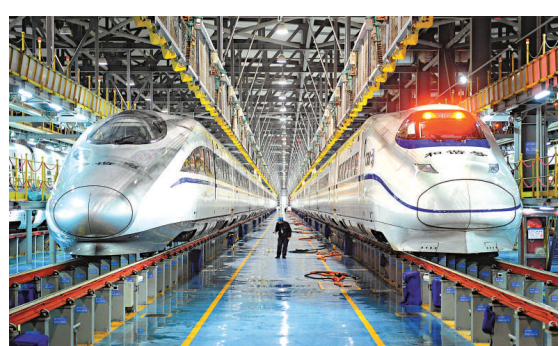
▲京哈、京深兩大高速客運通道年底將貫通，北京至哈爾濱、北京至深圳的高鐵列車行程需時分別約為5小時和8小時 資料圖片

【本報訊】中國鐵道部16日確認，京哈、京深兩大高速客運通道年底將貫通，北京至哈爾濱、北京至深圳的高鐵列車行程可分別約為5小時和8小時。此前，京哈、京深高鐵大通道曾計劃在去年年底建成，但工期過於緊張。