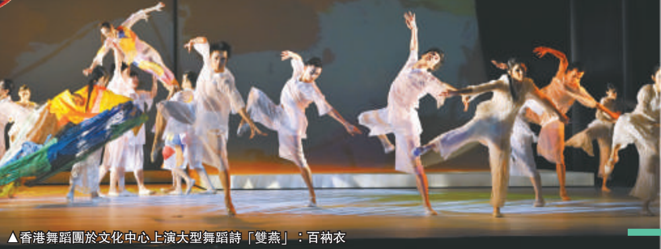
香港舞蹈團於文化中心上演大型舞蹈詩「雙燕」：百衲衣