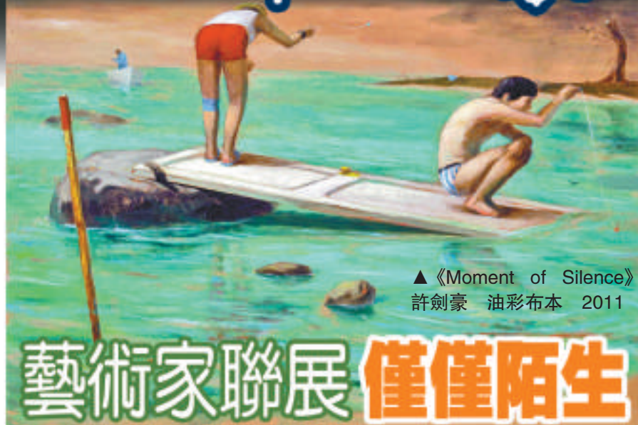
《Moment of Silence》許劍豪 油彩布本 2011