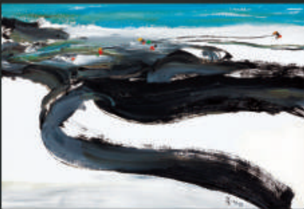
《補網》有奔放濃烈的色調，畫幅鋪排有極強的律動和節奏感