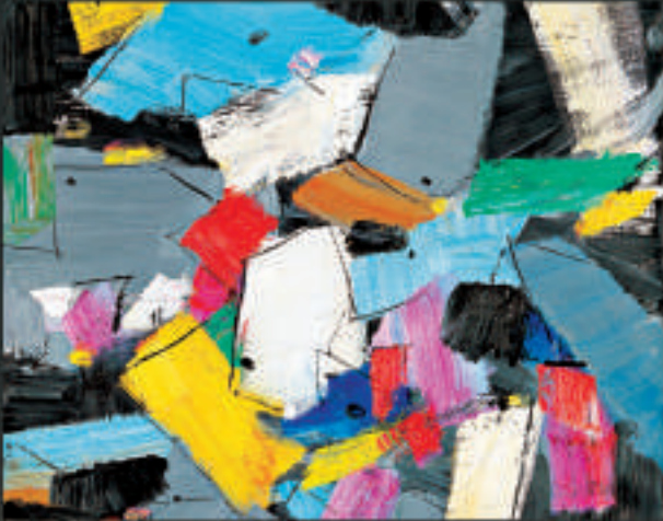
以色彩對比強烈的塊面布局的《百衲衣》