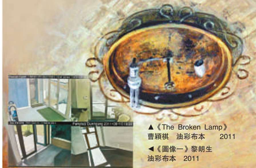
《The Broken Lamp》曹穎祺 油彩布本 2011

本次展覽由張景威客席策展，展期至三月十七日結束，免費入場。地點香港灣仔隆安街5-6號地下紅彩畫廊（北帝廟對面），查詢可電二八九三七八三七。