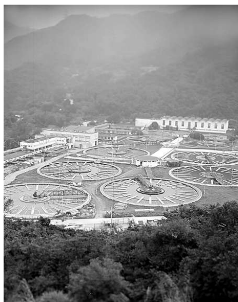
劉清平的攝影作品《沙田濾水廠的技術人員》