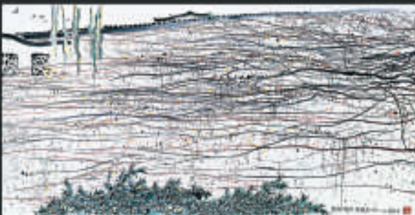
《鄉情與鄉愁》中可見吳冠中指揮畫面線條的技巧

「吳冠中——畫·舞·樂」展覽正在香港藝術館展出，展期至四月十五日。查詢可電：二七二一〇一一六或瀏覽香港藝術館相關網頁：www.lcsd.gov.hk/CE/Museum/Arts。