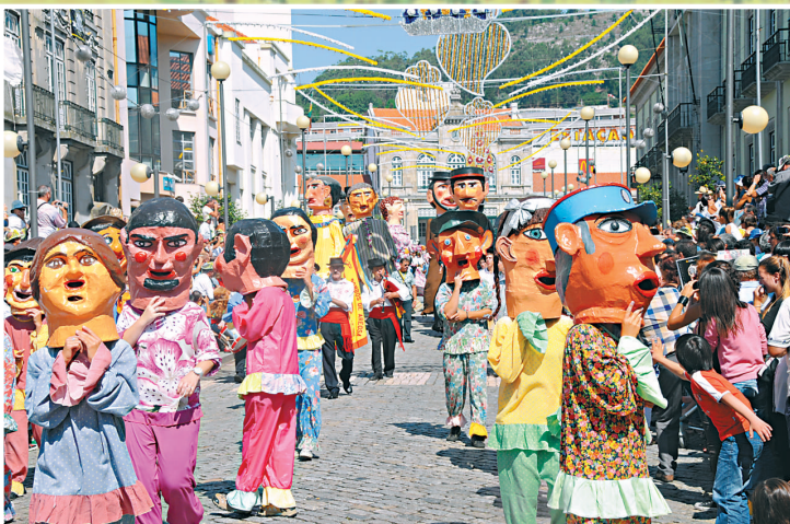
頭戴「巨人」面具的巡遊隊伍經過維亞納堡老城區的大街

每年8月下旬，數十萬計的葡萄牙人和外地遊客齊集葡萄牙北部的海濱小城維亞納堡，觀看一年一度的阿戈尼亞節巡遊。當地居民穿上傳統民族服裝，來到老城區的主要街道會合，並於共和國廣場上奏起鼓樂。當天早上大約10時起，巡遊隊伍正式起步，走在最前的是頭戴面具的「巨人」方陣隊伍，緊接著的是由鼓樂隊、風笛隊和手風琴隊組成的民間樂團方陣，樂手都穿上色彩繽紛的民族服裝，頭戴呢帽，身穿白襯衣，外罩馬甲，頸上還繫上鮮艷奪目的紅色領巾。鼓樂隊後面則是巡遊隊伍的主力軍，他們由400多名少女組成，每人都穿上色彩艷麗的頭巾和長裙，還披上刺繡披肩和繡花馬甲，再配襯上款式繁多的項飾、耳環和繡花鞋等，全都妝扮得厚樸可愛。巡遊隊伍最後以裝飾得花枝招展的花車作壓軸，氣氛熱鬧。