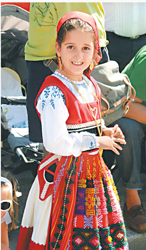
小女孩穿上艷麗的民族服飾，參與阿戈尼亞節大巡遊

香港的漁民每年都會舉辦天后誕等傳統節慶活動，而遠在歐洲西端的葡萄牙也有類似的大型祭典，就是每年8月底舉行的阿戈尼亞節。