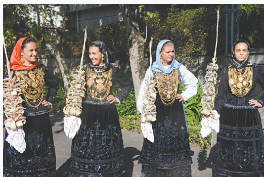
穿金戴銀的少女盛裝出席大巡遊活動

這個開幕式的盛裝大巡遊是一連3日節慶活動的重頭戲，隊伍沿利馬河出海口的海濱大道上演，街道兩旁還樂起臨時看台，供遊人觀賞巡遊盛況。此外，節日期間每天都會舉行各種傳統民俗活動，入夜後還有煙花晚會。