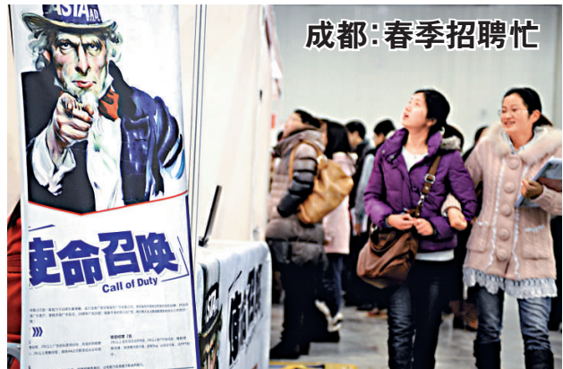
▲成都春季特大型人才招聘會暨中高級人才洽談會近日在成都舉行，招聘會提供崗位逾六萬個。圖為應聘者在招聘會現場了解職位信息。

廣東省人力資源和社會保障廳官員27日在順德舉行的全省就業工作座談會上表示，今年六大措施促就業，全年新增城鎮就業120萬人，就業困難人員就業10萬人，年內應屆高校畢業生就業率達90%以上。 2012年將重點抓好六項工作：一是落實好扶企穩崗的政策，千方百計穩定和拓展就業崗位；二是大力實施南粵高校畢業生就業推進行動，切實推進高校畢業生就業工作；三是實施區域勞動力轉移規劃，健全農村勞動力培訓激勵機制，大力推進農村勞動力培訓轉移就業；四是深入推進創業帶動就業工作，實施扶創創業帶動就業計劃，全年扶持10萬人創業，帶動就業50萬人；五是着力提升公共就業服務效率和水平，推進就業服務規範化、品牌化、精細化；六是探索建立統一規範的人力資源市場。 （本報記者袁秀賢）