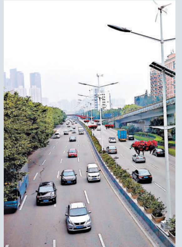
▲深圳汽車保有量突破二百萬輛，給城市建設與發展帶來諸多困擾

學化、精細化和動態化管理水平，有效處置各類路面發生的突發事件，遏制擁堵進一步加劇勢頭。