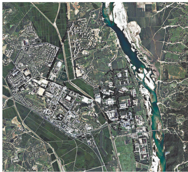
▲朝鮮寧邊核設施，攝於2002年8月13日的衛星圖片資料圖片