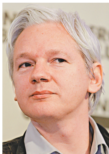
▲「維基解密」創辦人阿桑奇27日出席新聞發布會

【本報訊】據法新社、澳洲《悉尼先驅晨報》消息：《悉尼先驅晨報》29日引述一份機密電子郵件稱，美國檢察官已經對維基解密網站創辦人阿桑奇擬定秘密指控。