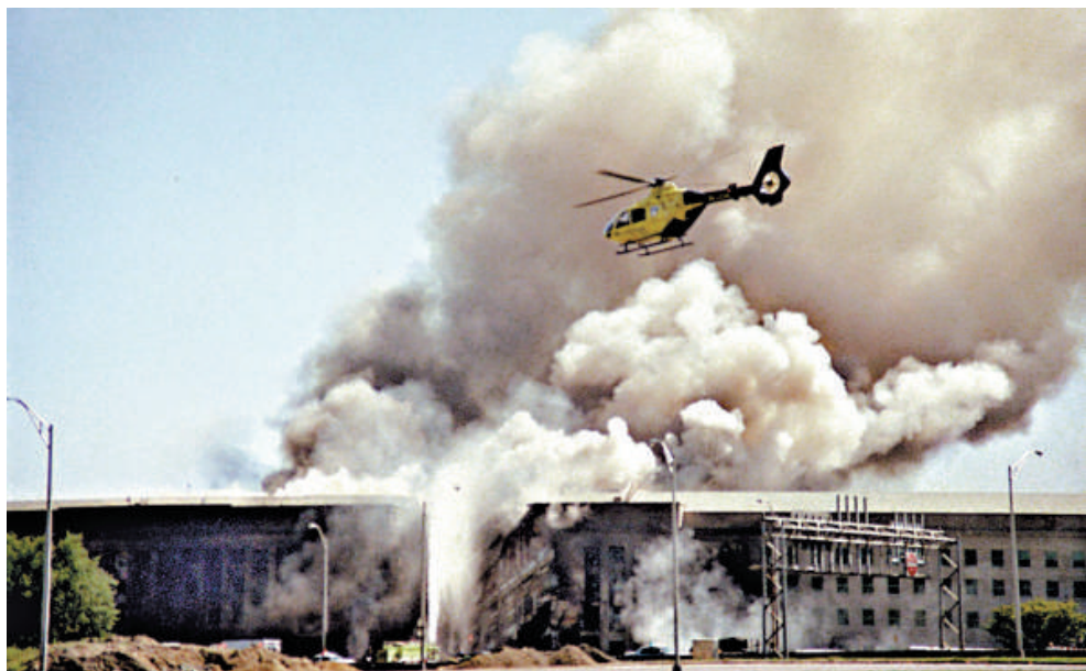
▲在2011年9月11日發生的恐怖襲擊中，五角大樓遭受重創 資料圖片

去年11月，《華盛頓郵報》揭露多佛殮房多年來一直將在伊拉克及阿富汗死亡的軍人的遺骸骨灰，棄置在佛吉尼亞州一個堆填區。這一處理方式包括無法辨認或者無人認領的屍骸部分，殮房沒有告知軍方家屬。空軍隨後承認，在2003年至2008年期間，至少將274名服役軍人的部分遺骸骨灰棄置於堆填區，最終在2008年開始實行將骨灰撒往大海的新政策。