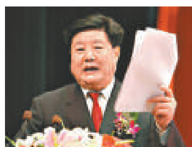
▲李子彬：企業30%-50%利潤被拿走了

李子彬還對有些經濟工作部門只服務大企業、漠視中小企業的機關作風不滿。據了解，李子彬上世紀60年代從企業做起，曾經當過技術員、工程師、廠長、深圳市市長、國家發改委副主任。現任中國中小企業協會會長。