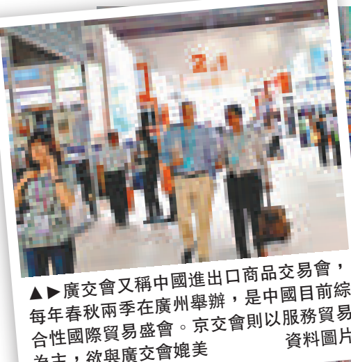
▲廣交會又稱中國進出口商品交易會，每年春秋兩季在廣州舉辦，是中國目前綜合性國際貿易盛會。京交會則以服務貿易為主，欲與廣交會媲美

他說，長期以來，發達國家以其發達的服務業為堅實後盾，在國際產業鏈中的研發、設計、營銷等高價值環節具有明顯優勢，服務出口的需求強烈。新興經濟體也越來越把服務業作為參與經濟全球化的重要渠道。近年來，金磚國家的服務貿易發展勢頭總體上要好於發達國家。中國舉辦京交會，正是為大力發展服務貿易，推動產業轉型升級、促進對外貿易均衡發展，有效提升國內產業的綜合競爭力，推動中國開放型經濟在更高層面和水平上參與全球競爭與合作，同