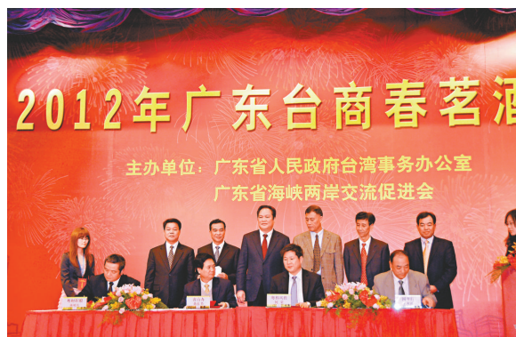
▲廣東省台辦分別與國家開發銀行廣東省分行等簽訂戰略合作協議助台企融資

廣東省委副書記朱明國致辭時表示，2011年粵台經濟文化交流合作持續深入推進，全年新增台資項目605個，全年對台進出口貿易523.4億美元。目前廣東省累計成立台資企業24859家，合同利用台資611.42億美元，實際利用台資503.11億美元。粵台交流交往不斷擴展，全年共有1944個團組12628人次赴台交流。