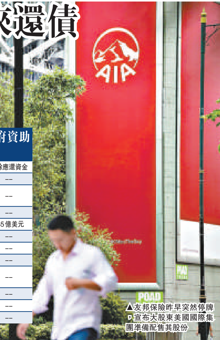
友邦保險昨早突然停牌，宣布大股東美國國際集團準備配售其股份。

公司董事會主席兼執行董事錢利榮表示，集資所得部分會用於拓展中國西部省份和海外銷售市場，如印度、巴西及俄羅斯市場，相信增長潛力很大。另一邊廂，光大銀行董事長唐雙寧昨日出席全國人大會議的間隙時表示，由於港股反彈，該行正考慮在香港上市的合適時機，並會把H股IPO發行價定在合理水平。