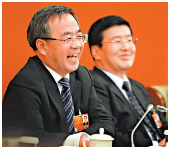
▲六日，內蒙古代表團舉行全體會議審議政府工作報告，內蒙古自治區黨委書記、人大主任胡春華（左）笑對蜂擁而至的媒體提問