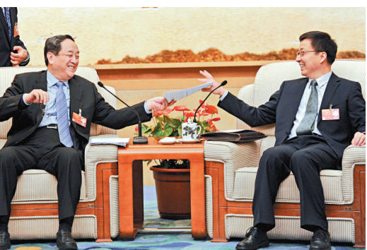
▲六日，上海代表團舉行全體會議審議政府工作報告。上海市委書記俞正聲、市長韓正會議開始前傳聞會議簡報

他介紹，內蒙古將採取四方面措施實現上述目標。繼續加大投入改善生產生活條件，自治區扶貧專項資金提高至2012年20億元；鼓勵農牧民向第二、第三產業轉移；對於部分自然條件比較惡劣，不具備生存發展條件的地區實行搬遷；對於喪失了勞動能力的貧苦人口，採取社會保障的方式解決貧困問題。