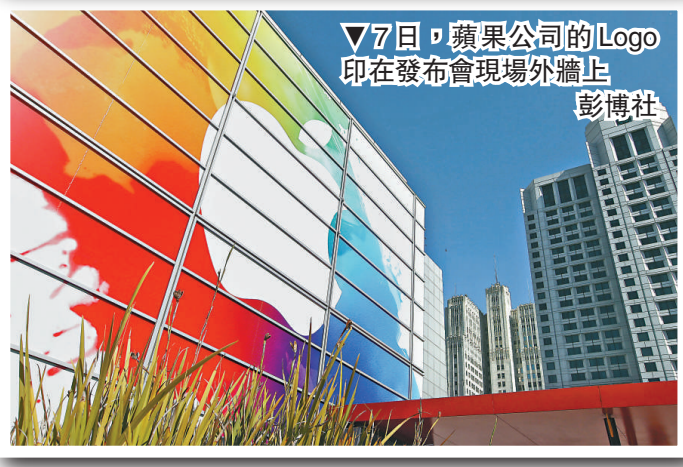
▽7日，蘋果公司的Logo印在發布會現場外牆上