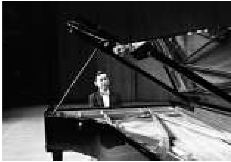
▲一九六九年傅聰在大會堂演出