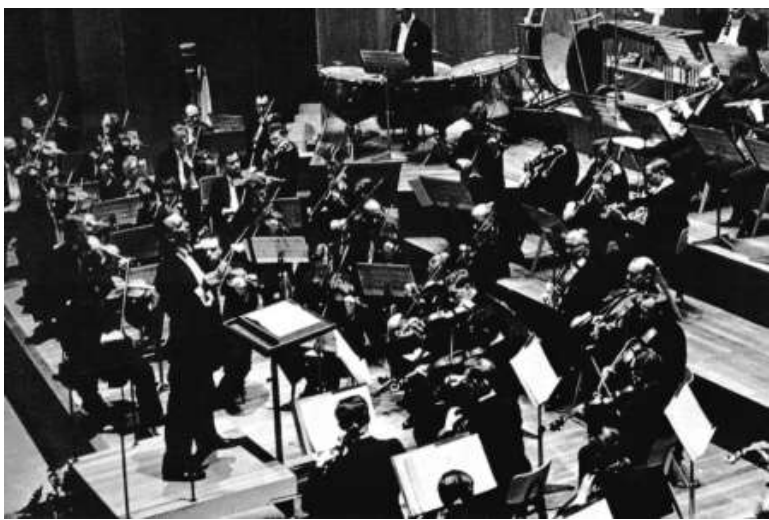
▲一九六二年，指揮馬琴·沙俊帶領倫敦愛樂樂團來港舉行五場大會堂開幕音樂會

共十小時的「動聽的歷史——大會堂五十年經典重溫」節目中，聽眾不但能夠再次回味上述部分表演單位的珍貴演出，亦可以重溫多個在大會堂出現的歷史時刻。在芸芸珍貴的聲音資料中，包括當年港督柏立基於香港大會堂開幕禮上的致詞，以及英女王伊麗莎白二世於一九七五年參觀香港大會堂時發表的演說。此外，多位文化藝術界名人，包括陳述文、盧景文、羅乃新、費明儀、葉詠詩及紀大衛等也會於節目中分享與大會堂有關的深刻回憶及趣事。