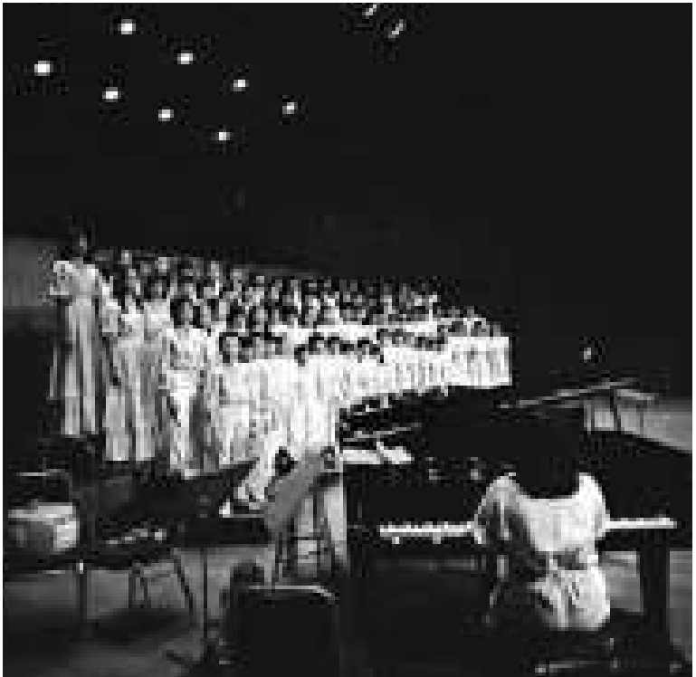
▲一九八三年香港兒童合唱團在大會堂演出