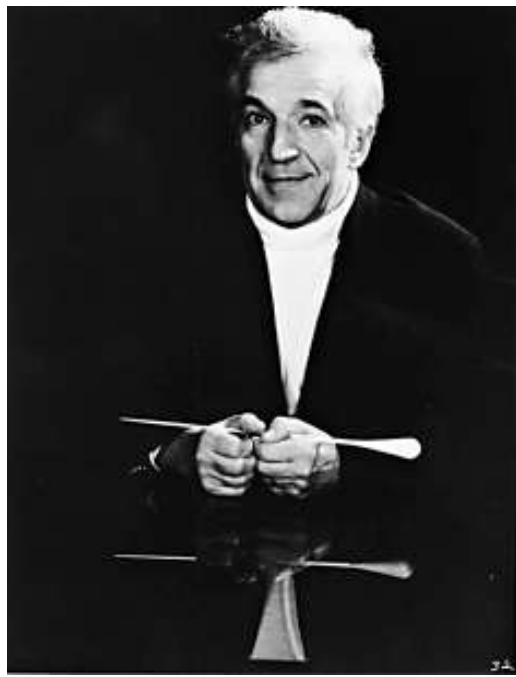
▲阿殊堅納西執指揮棒

「動聽的歷史——大會堂五十年經典重溫」於三月份連續五個星期六晚上八時至十時在香港電台第四台(FM97.6-98.9)播出，由著名音樂史學家周光葵及港台第四台節目主持李嘉盈以聲音帶大家走進時光隧道，回顧香港大會堂的五十年經典。節目逢星期四下午二時至四時重播，聽眾亦可於港台第四台網頁(radio4.rthk.hk)上重溫內容。