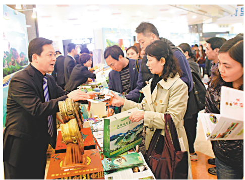
▲國家旅遊局來港宣傳歡樂健康遊，參觀者反應踴躍。

【本報訊】由國家旅遊局主辦的2012中國歡樂健康遊主題推廣活動，昨日起一連四天面向香港公眾展開。昨日在荷里活廣場舉行開幕儀式，現場有內地十八個省、自治區和直轄市旅遊局準備的旅遊宣傳品，並有少林功夫、少數民族服裝展示等演出，吸引大批市民駐足，氣氛熱烈。