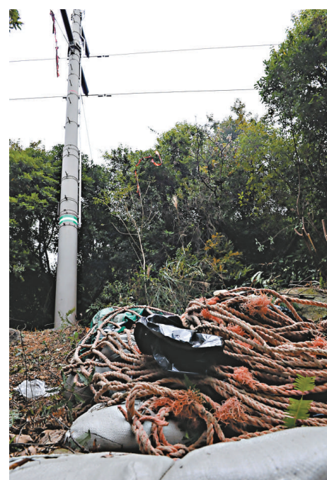
去年初一架直升機在吊運期間誤觸高壓電纜引致搶火，地面兩名工人受傷。圖為當日意外現場。資料圖片

至於粵港自駕遊措施，在香港社會引起不少反對意見，范徐麗潔認為，這是一個溝通上的問題。她表示，首階段香港人到內地自駕遊現已實施，而基於有來有往的原則，是可以允許內地人到香港自駕遊，但亦要考慮實際環境。「香港地方小，道路使用量已很飽和，自駕人士到香港後限制很多，且到各旅遊景點遊玩又要解決停車位的問題，其實不算方便，同時亦要考慮到兩地在駕駛習慣上有差異，故認為要仔細衡量允許內地車輛來港自駕遊的數量。」