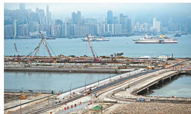
▲特區政府批出啓德郵輪碼頭租約予WCT集團。

發言人續指，意外調查組向肇事直升機公司建議，直升機在架空高壓電纜附近進行吊運時，應暫停使用任何帶有導電物料的吊運長索組件，直至調查工作完畢。