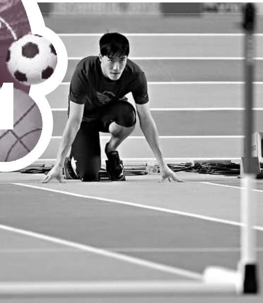
▲中國選手劉翔在訓練中準備起跑