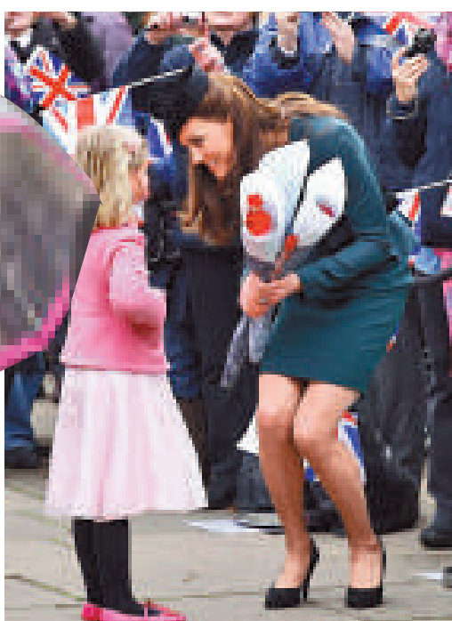
▲凱特接受當地兒童獻花 互聯網