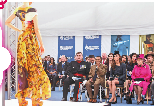
▲英女王伊麗莎白二世(右一)和劍橋公爵夫人凱特(右二)8日在德蒙福特觀看該大學學生表演的時裝秀 美聯社