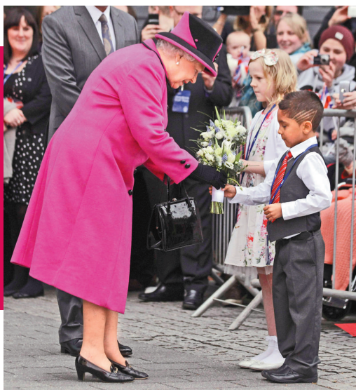
◀英女王伊麗莎白二世8日到訪英格蘭中部城市列斯特