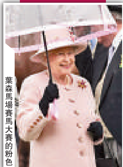
葉森馬場賽馬大賽的粉色