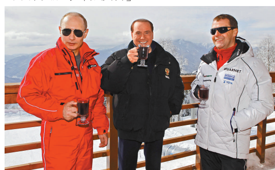
▲普京(左)、梅德韋傑夫(右)及意大利前總理貝盧斯科尼(中)8日在索契度假區

據悉，普京此次的度假勝地索契是2014年冬季奧運會的舉辦地。因此有媒體猜測，普京此行也是為了索契形象「做廣告」。