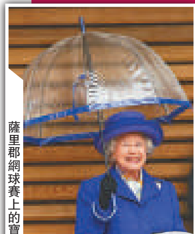
薩里郡網球賽上的寶藍色

85歲的伊麗莎白二世女王是繼維多利亞女王後，英國歷史上第2位慶祝在位60周年的君主，也是最高齡的在位君主。