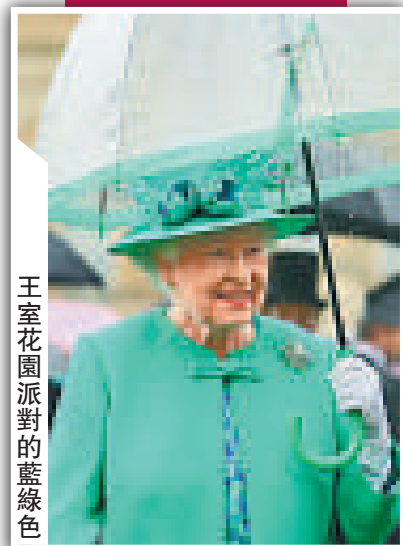
王室花園派對的藍綠色