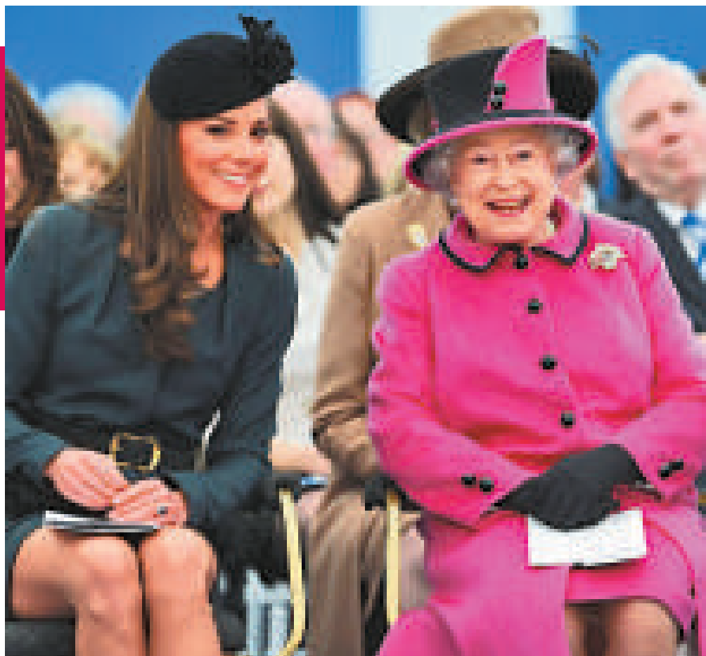
▶英女王伊麗莎白二世(右)和劍橋公爵夫人凱特(左)8日在列斯特開始全國巡訪首站

【本報訊】據英國廣播公司9日消息：英國女王伊麗莎白二世8日由菲臘親王及劍橋公爵夫人凱特陪同，展開第一個慶祝登基60周年(鑽禧)訪問行程，這趟全國巡訪將持續4個月。