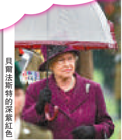
貝爾法斯特的深紫紅色