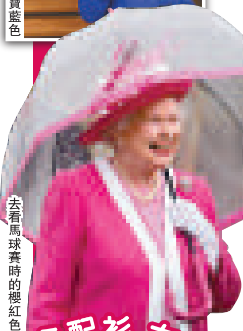
去看馬球賽時的櫻紅色