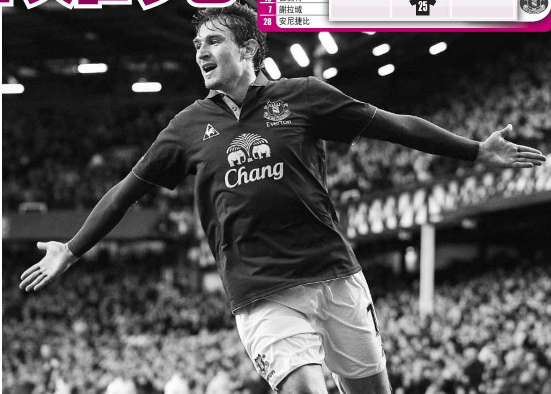
▲謝拉城上仗一箭定江山打敗熱刺

愛華頓最近越戰越勇，接連於主場挫敗曼城、車路士及熱刺，當然有力抵禦宿敵。「拖肥糖」近20場比賽只得3仗開大盤，近16場聯賽更只有1仗開大，反映球隊踢法穩陣又極具韌力，故此極有理由相信今仗不會出現多入球。