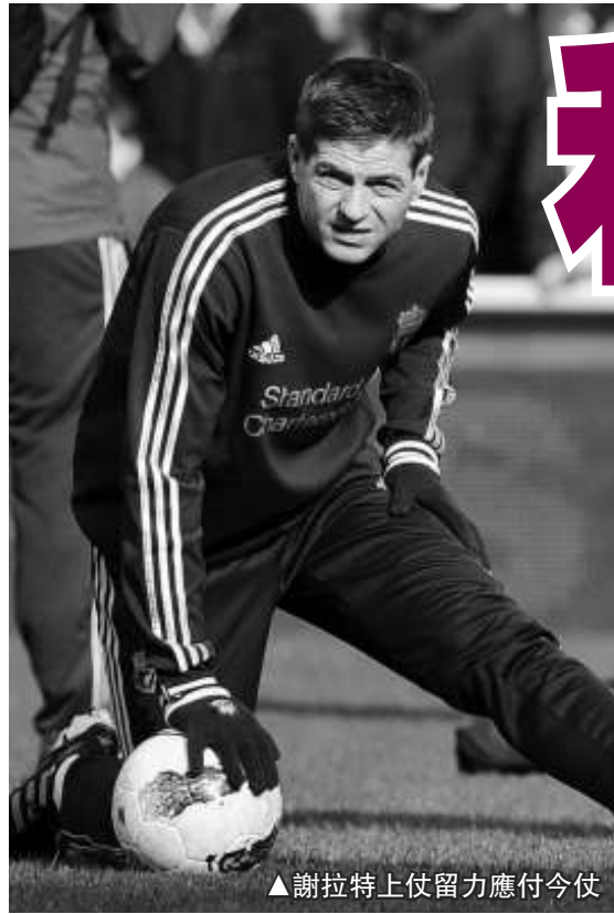
▲謝拉特上仗留力應付今仗