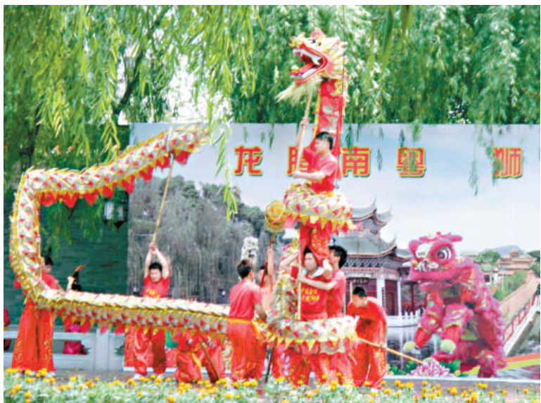
▲番禺的傳統舞龍