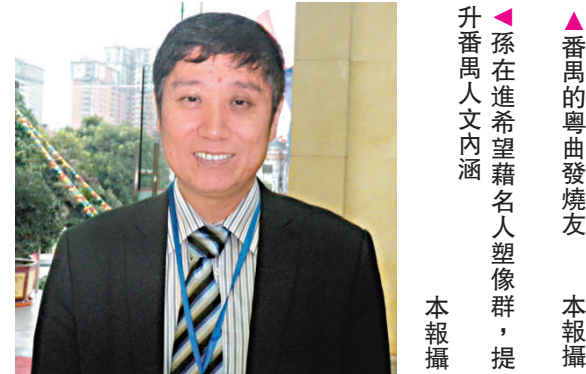
▲番禺的粵曲發燒友