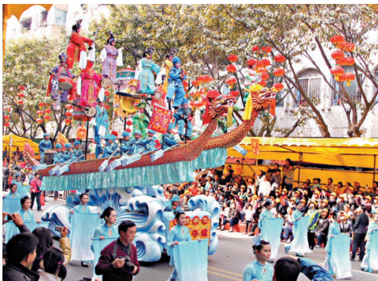
▲番禺的沙灣飄色享譽海內外