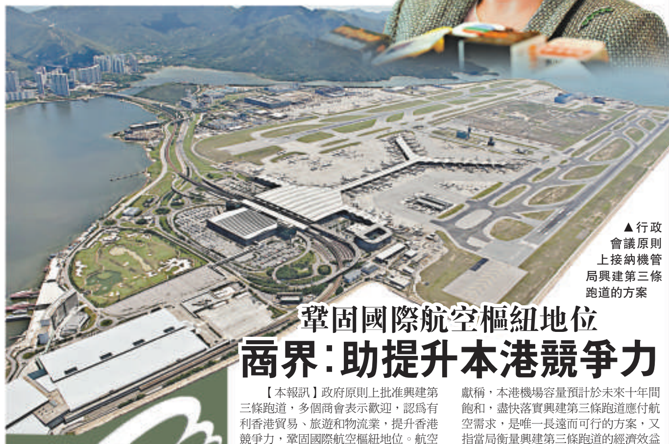
▲行政會議原則上接納機管局興建第三條跑道的方案