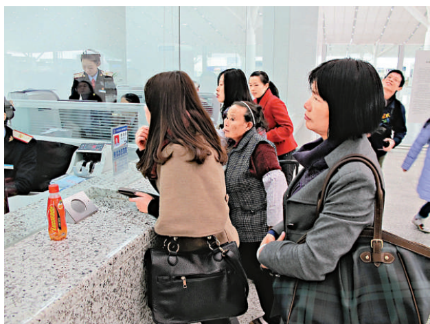
▲深圳高鐵直通湘鄂高鐵路車票開始預售

該負責人表示，律師宣誓由設區的市級或者直轄市司法行政機關會同律師協會組織，應當在律師獲得執業許可之日起3個月內，採取分批集中的方式進行。司法部黨組根據修訂後的律師法和中辦發[2010]30號文件精神，高度重視並不斷加強律師管理工作，設區的市級司法行政機關近年來認真履行法律賦予的律師執業監管、年度考核和處罰權，已經具備了良好的工作基礎，因此，決定規定由設區的市或者直轄市司法行政機關會同律師協會組織宣誓。