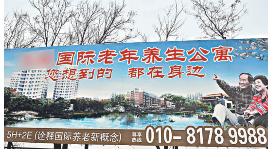
▲小產權房，曾是低價房的代名詞。然而，目前小產權房在一些城市不僅規模越來越大，品種也越來越多，價格讓人嘆爲觀止 新華社 ▲北京市昌平區鄭各莊村新建的晚清建築格局四合院竟然是「小產權房」 新華社