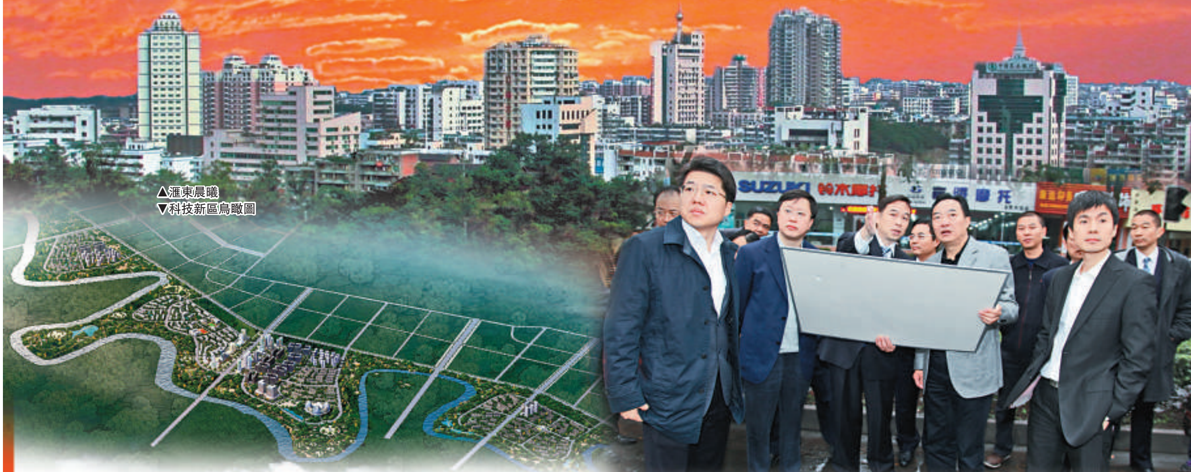
▲匯東晨曦 ▼科技新區鳥瞰圖