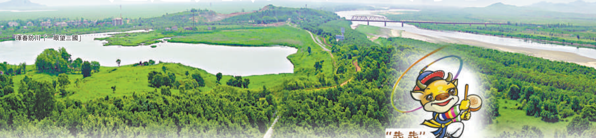
琿春防川「一眼望三國」