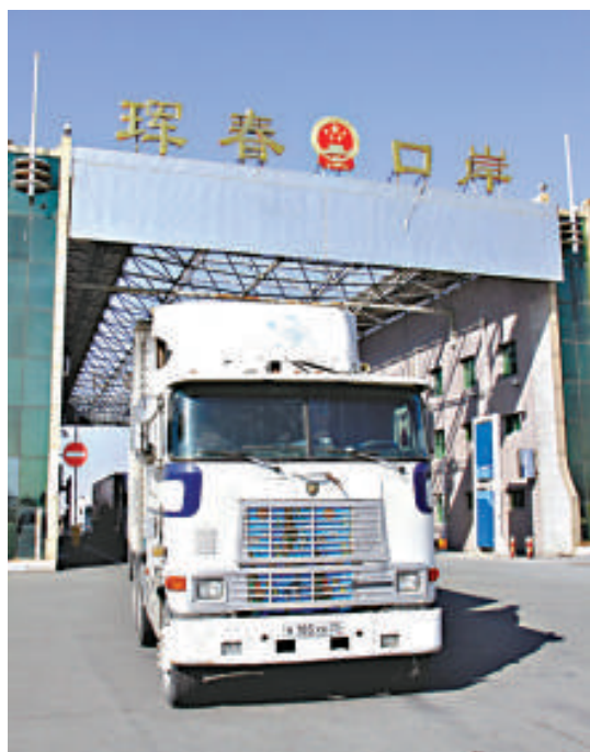
▲中俄琿春口岸是吉林省唯一的對俄公路口岸，口岸設計年過客、過貨能力分別為60萬人次、60萬噸

基礎設施加強，口岸功能提升。延邊州共投入資金3億多元進行了口岸跨境橋、聯檢樓及附屬設施的建設，改造了延吉航空口岸出入境通道及聯檢樓附屬設施；維修了琿春圈河口岸、三合口岸和開山屯口岸跨境橋，新建了琿春沙陀子、圖們、南坪、古城里、開山屯等口岸聯檢樓及附屬設施；維修改造了三合口岸聯檢樓。目前，古城里口岸、沙陀子口岸聯檢樓及相關附屬設施已經建設完成，達到了升級為國家級口岸的驗收標準。安圖雙目峰公務通道於2009年9月提升為臨時口岸。延邊州口岸基礎設施建設成效明顯，部分口岸已經建設成為花園式口岸，成為當地的旅遊景點。