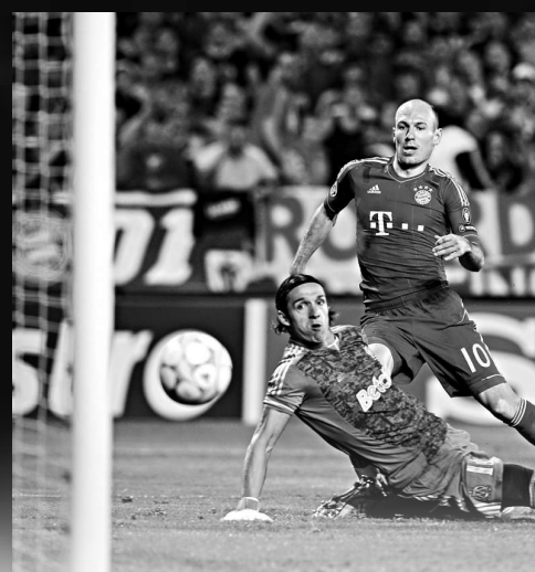
▲洛賓(後)為拜仁錦上添花