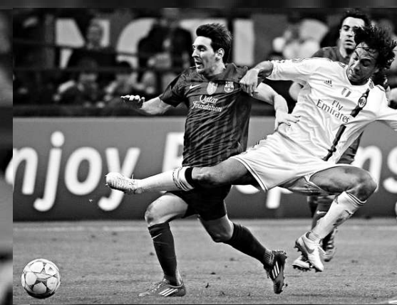
▲尼斯達(右)「掃蝗腿」阻止美斯領黃牌