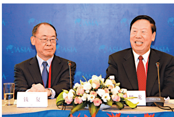
兩岸企業家2日在博鰲論壇舉行圓桌會議，由大陸社保基金理事會理事長戴相龍(右)和台灣的兩岸共同市場基金會最高顧問錢復主持。

表示，兩岸金融政策領域的開放步伐跟不上業者需求，需要迎頭趕上。尤其需要放寬對銀行、證券、保險業種種投資限制，加快解決雙方企業界迫切需要的兩岸貨幣清算問題，才能開啓兩岸金融合作新紀元，為制度化的經濟合作創造更大的利益。