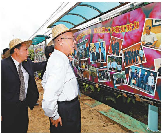
吳敦義(前左二)與夫人蔡令怡參加博鰲亞洲論壇，3日上午參觀台商黃益豐在海口種植的黑金剛蓮霧園。

此前，曾在台灣多次主持遙祭黃帝陵的中國國民黨榮譽主席吳伯雄，3月24日在河南省新鄭市出席「壬辰年黃帝故里拜祖大典」，拜祭黃帝並祈福上香。吳伯雄去年也曾前往陝西參加黃帝陵祭典，他說，從遙祭到祭典，再到黃帝故里，象徵著彼此關係的拉近；他希望中華民族不再有內戰，海峽兩岸不再內耗。