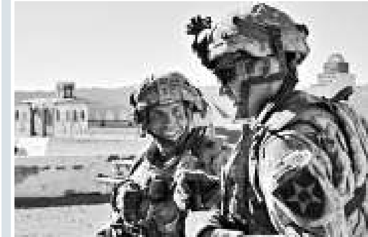
▲美軍牧師7日在多佛空軍基地面對在都柏林陣亡士兵的屍體默哀