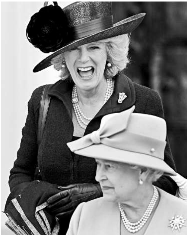
▲2006年4月12日，卡米拉與英女王伊麗莎白二世（下）離開英國桑德赫斯特皇家軍事學院

另有接近王室的人士稱卡米拉是凱特的好顧問，「她（卡米拉）既是凱特的婆婆，也是凱特的王室顧問，她成功引導凱特融入王室。」