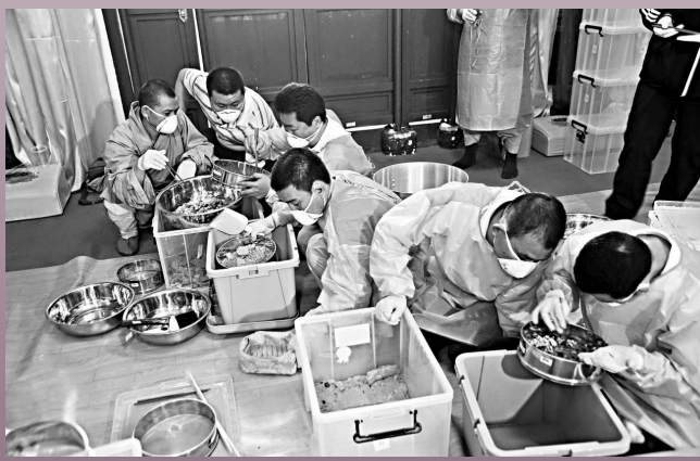
▲弘法寺工作人員正加緊進行靈骨和舍利的分揀工作