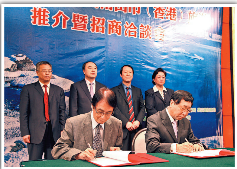
▲興安盟阿爾山市（香港）旅遊推介會暨招商洽談會簽約儀式

在這次蒙港經貿合作活動周期間，興安盟與香港企業簽訂了6類13個項目合作協議書，合作項目總額1.9億美元，是2011年的6倍，其中，興安盟行政公署與香港中興集團（中國）股份有限公司簽訂了總投資10.5億元人民幣蛇紋岩綜合開發利用建設項目，與香港國際貿易促進會簽訂了友好合作協議。興安盟還與香港有關方面簽訂了貿易類項目6個、五星級酒店項目1個、旅遊類項目3個、礦泉水項目1個。據悉，興安盟與港企2011年簽約合作項目履約進展順利，履約金額達1100多萬美元。