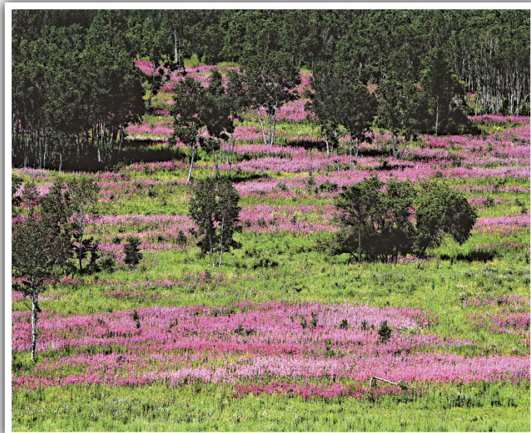
▲柳蘭花開 大地盛裝