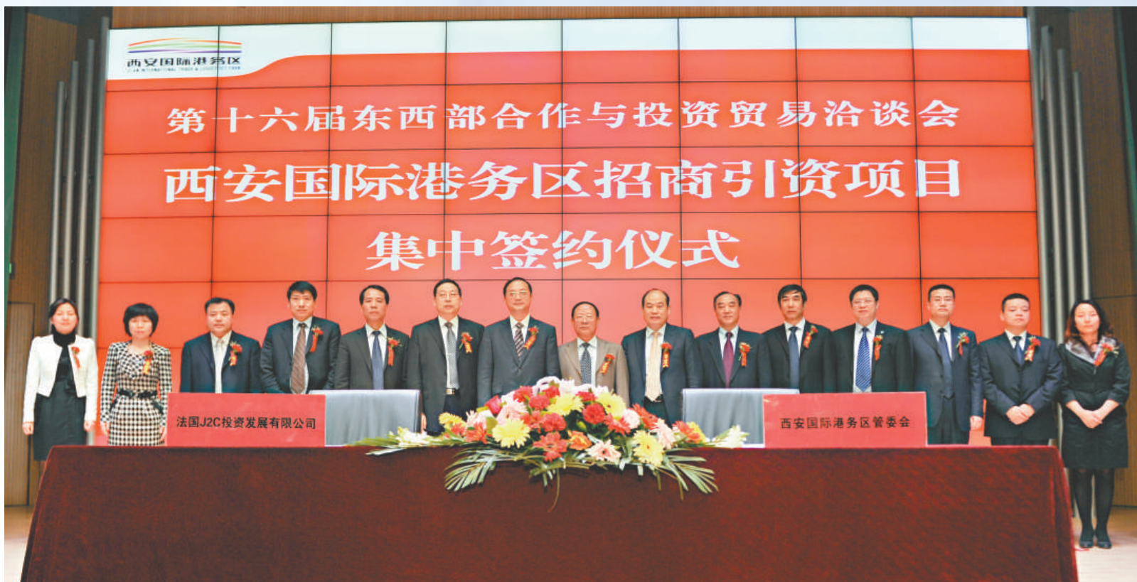
▲西安國際港務區西洽會簽約現場

積極承接來自東部地區和國際上的產業轉移是陝西省發展外向型經濟的重要內容，也是破解經濟外向度低的重要措施。韓松表示，在陝西省積極承接產業轉移過程中，以西安國際內陸港等投資硬環境為核心，搭建承接產業轉移的戰略平台，增強陝西的資源集聚力、區域帶動力、產業支撐力。