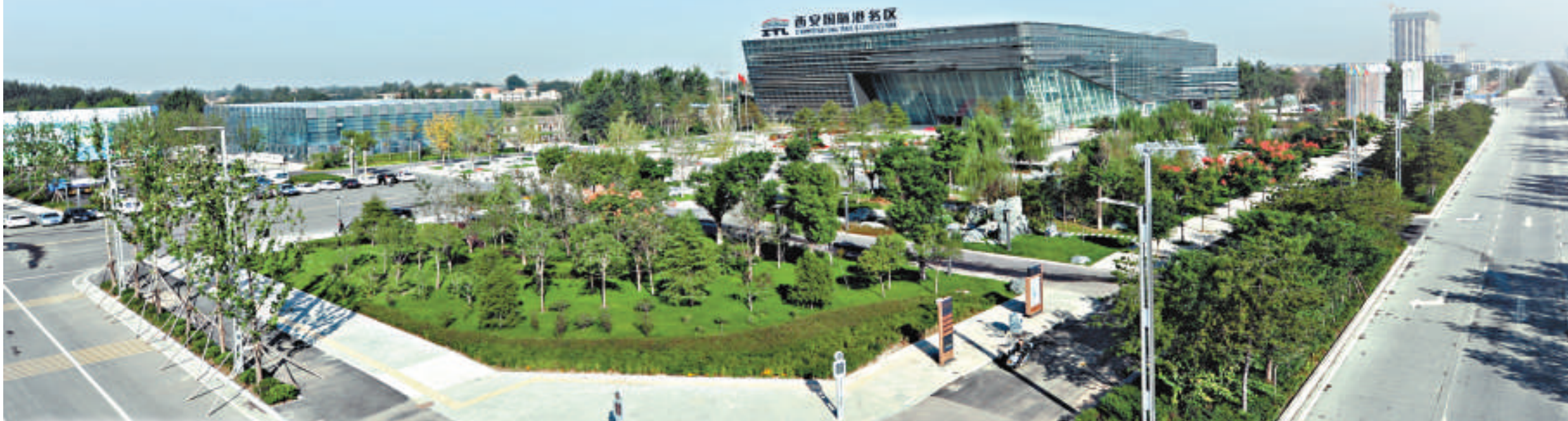
▲西安國際港務區綜合辦公大樓鳥瞰圖

經濟全球化導致產業國際化，信息全球化注就文化多元化。一個產業國際化、文化多元化發展的中國最大國際內陸港正在全力助推陝西建設成為內陸型經濟開發開放戰略高地！