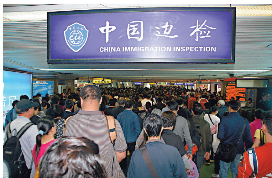
▲最受港人青睞的羅湖口岸昨日將試行新的通關政策

深圳海關監控披露稱，深港口岸活躍逾二萬名職業「水客」，走私手段主要一日多次往返香港及內地，少量多次「螞蟻搬家」式攜帶超量的電子產品、奶粉等熱門貨品入境內地販售。