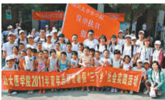
▲參與醫療扶貧汕大醫學院的志願者

生產「加衛苗」的美國默沙東藥廠昨特別向傳媒發表聲明，重申並沒有以任何形式參與或組織任何該疫苗的團購活動，亦從未提供有關疫苗給任何團購公司，藥廠表明，「加衛苗」乃醫生處方藥物，只向衛生署註冊西醫、藥房或醫療機構供應，他們已向衛生署及香港醫學會反映問題。