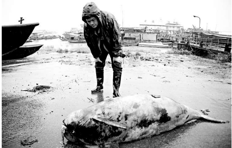
4月中旬，在湖南岳陽鹿角鎮碼頭，一隻江豚的屍體被打撈上岸。整個長江流域這一物種僅剩下約1200頭左右，其種群數量甚至已經比國寶大熊貓還少 中新社

鄒義賓指出，目前，江豚是否能夠生存下去，固然是大家討論的重要議題，但徹底弄清楚江豚的死亡原因，才是最重要的。