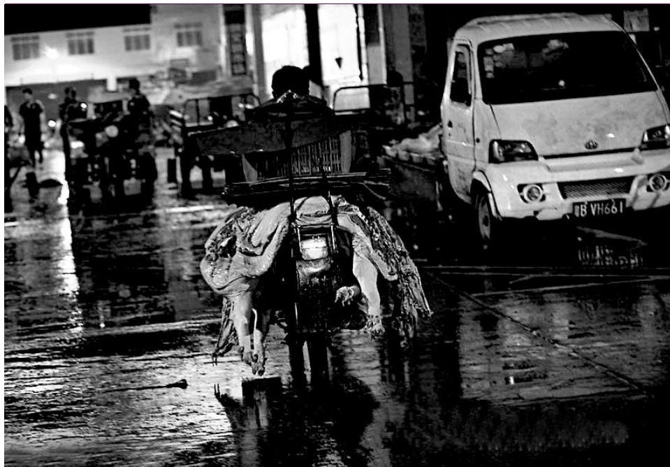
死豬肉每天用摩托車運往周邊市場