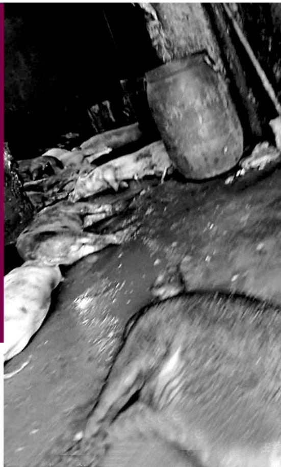
豬肉的貨車路過，亦未堵截，引發市民質疑。

日前，深圳遭曝光黑作坊日產萬斤病死豬肉，經過漂白加工流入市場，引來社會關注。深圳警方迅速介入調查，刑拘12名涉案人員，但數量驚人的死豬肉已流入深圳當地市民餐桌而無法追回。同時，市民質疑有深圳執法人員勾結死豬肉黑作坊的說法得到證實。據深圳市政府證實，管轄死豬肉屠宰場的光明執法隊多人因涉嫌提供保護傘，已經被停職並接受調查。