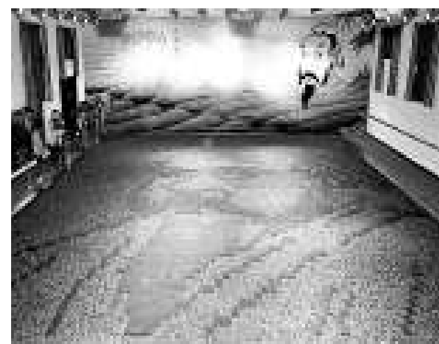
▲以「茶聖」陸羽為原型的世界最大茶葉畫像18日在湖南沅陵製作完成，該畫像共使用綠茶鮮葉1188斤，畫像面積達174平米。據世界紀錄協會認證，這是迄今為止全球最大的茶葉畫像 本報記者張思靜

為期半年的打擊粵港澳侵權貨物跨境運輸「海龍行動」自去年1月開展以來，查獲涉及港澳的侵權貨物543萬件，案值達3200餘萬元，主要涉及電子產品、日用化妝品、服裝、鞋帽等商品。海關廣東分署法規處官員表示，「海龍行動」為今後粵港澳三地海關加強跨境的合作提供了一個很好的經驗和借鑒。【本報記者梁茹】