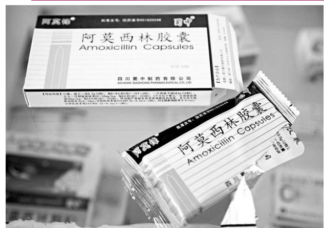
▲藥用空心膠囊涉嫌超標，13個產品被暫停銷售和使用，4月16日在江蘇南通一藥店櫃檯拍攝的阿莫西林膠囊

深圳市藥監局連日來的市場排查結果顯示，受輿論曝光的13種問題藥品中，有2種曾在深圳市場上銷售。四川蜀中製藥有限公司生產的「阿莫西林膠囊」（批號：120101），目前庫存的64盒貨品已被責令暫停銷售，就地封存。