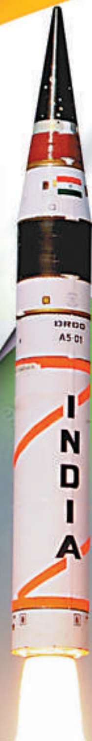
印度遠程彈道導彈「烈火-5」19日試射成功

中國軍事評論家、海軍少將張召忠教授也認為，「烈火-5」射程達到8000公里應該是沒有問題的，但印方很少見地刻意把射程說成5000公里，主要擔心得罪歐洲，因為8000公里的射程使大半個歐洲都處於導彈的射程之內。