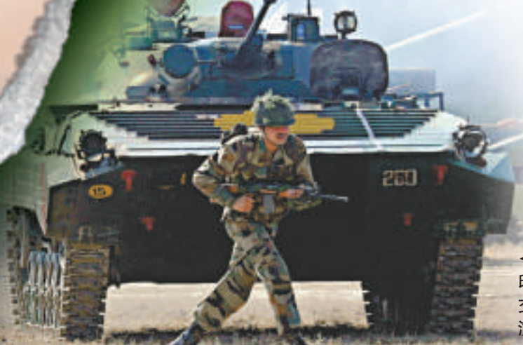
▲1月23日，印度在卡薩武器交易會進行軍事演習