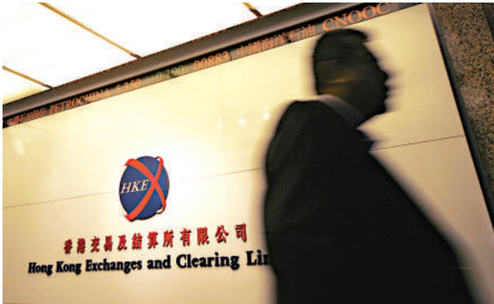
◀港交所若然勉強讓質素欠佳的公司上市，倒頭來損害投資者利益，也賠上了港交所聲譽

筆者在雲南也遊歷了與越南接壤的紅河州地區，得知兩地邊貿活躍。在桂滇邊區居住了很多少數民族，他們的分布多橫跨兩國，故跨境流通自然活躍，而這也成了推動兩地邊貿的重要因素。當地政府應多利用這種人文聯繫來促進雙邊交流，如鼓勵中方的少數民族人士「走出去」跨境經營，以便進一步強化雙邊交流網絡。此外，加強邊區的交通及物流樞紐建設亦至為必要。中國西南與東盟南鄰間的沿邊經貿發展，基本上仍處初步階段，由於跨境自貿區已經建成，今後必須開拓更多的方式及渠道，以擴大交流範圍及規模了。