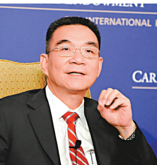
▲下月初任期屆滿的世行首席經濟學家林毅夫在華盛頓智庫舉行座談，討論他新近出版的《解密中國經濟》一書

【本報訊】中新社華盛頓二日消息：擔任四年世界銀行首席經濟學家兼高級副行長後，林毅夫將於下月初卸任回國。他以一本書與華盛頓作別。去年年末，《解密中國經濟》一書出版，旨在以「局內人」身份解讀三十多年來舉足輕重的經濟事件——中國崛起。