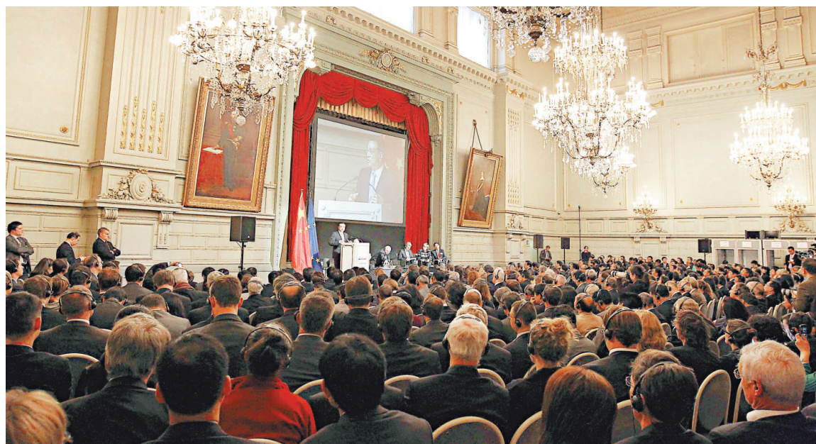
▲李克強三日在中歐城鎮化夥伴關係高層會議開幕式致辭表示，當「歐洲設計」遇上「中國製造」，「歐洲技術」遇上「中國市場」，就會產生顯著效應。

首先，共促綠色發展。中歐應加強在新能源和可再生能源、節能環保產業、循環經濟以及廢棄物利用等方面的合作，共同建設綠色城市、低碳城市。