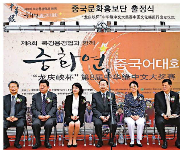
▲為慶祝中韓建交二十周年，「龍慶峽杯」第八屆中華緣中文大獎賽、「中國文化韓國行」、「2012中國歡樂健康遊」全國巡迴宣傳巴士的出發儀式三日在首爾世界公園和平廣場舉行。中國駐韓大使張鑫森（左四）和韓中友好協會會長曲歡（左三）等參加活動啓動儀式。 新華社

四月三十日，韓國海警在黃海海域欲以「非法捕撈」為名扣押中國貨運輪船「浙玉漁運581」號，與中方船員發生衝突。次日，韓國木浦海洋警察署以揮舞兇器刺傷其海警為嫌疑，針對漁船船長和駕駛員申請了拘捕令。