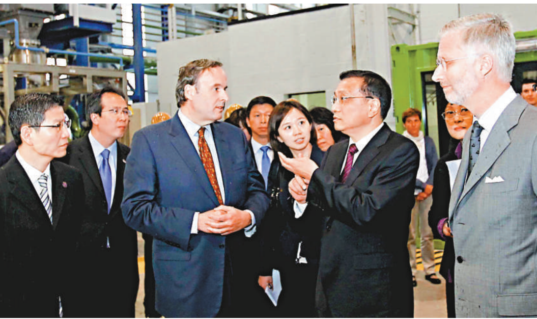
▲李克強二日考察比利時優美科集團電子垃圾處理廠，比利時王儲菲利浦（右一）陪同考察

【本報訊】中新社布魯塞爾二日消息：中國國務院副總理李克強二日參觀了比利時優美科集團電子垃圾處理廠。李克強表示，希望優美科集團同中方有關企業積極探討推進在處理電子垃圾領域的互利合作，共同研發、推廣並示範應用先進技術。