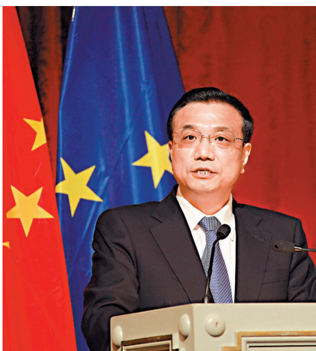
▲中歐城鎮化夥伴關係高層會議三日在布魯塞爾舉行，中國國務院副總理李克強出席開幕式並致詞。

【本報訊】中新社布魯塞爾三日消息：中國國務院副總理李克強三日在此間闡述中國城鎮化發展戰略，提出中歐應把城鎮化作為務實合作的新平台，加強節能環保、新能源等領域合作，分享中國城鎮化和歐洲高技術產業化帶來的巨大效益。