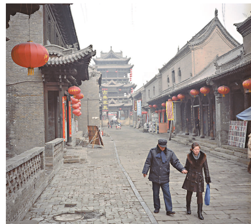
晉中古城，女子牽父親的手散步

「若干年後，上海人見到這張照片，說不定會感慨：哦，原來當年上海還見得到三輪車。」他指着其中一張照片說。那張照片裡，藍白方格的床單在一根晾衣繩上隨意搭着，遮住一輛老式三輪車的車座和把手，只露出生鏽的輪子。