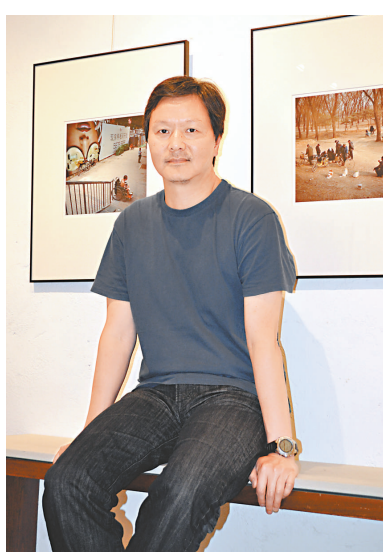
攝影師「王身敦說，離開蓋蒂圖片社，是為「做自己的本報攝」