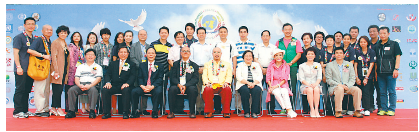
▲千人盆菜宴主禮嘉賓與活動幹事大合影

為了推動世界和平，配合聯合國千年計劃，於4月20日（聯合國中文日）至22日（國際地球日）一連三天，在香港維多利亞公園舉行「推動聯合國千年發展計劃，世界和平祈禱大會暨慶祝香港特區成立十五周年」大型活動圓滿結束。為了落實這次大會的三個主題：「和平、博愛、希望」，展現人類追求和平、博愛和充滿希望的訴求，日前（一連兩周）在九龍、新界各區舉行巡迴延續性嘉年華會活動，以行動和全港市民體現和實踐「和平大會」的工作。適逢佛誕誕開120席，一千多名老人盆菜宴慶回歸，參