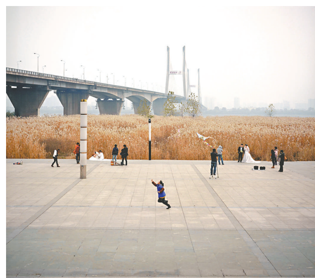
武漢長江邊，小女孩在放風箏

他想要的，是中肯與溫和，是「企後小小」的姿態。為此，他特意用6×6的菲林相機拍攝，因為喜歡菲林的質感，因為正方形圖片一張張羅列開，「有方塊字的穩厚」。