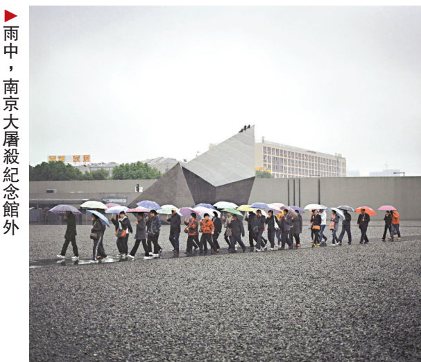
雨中，南京大屠殺紀念館外