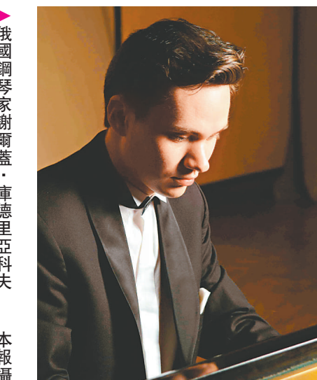
▶俄國鋼琴家謝爾蓋·庫德里亞科夫