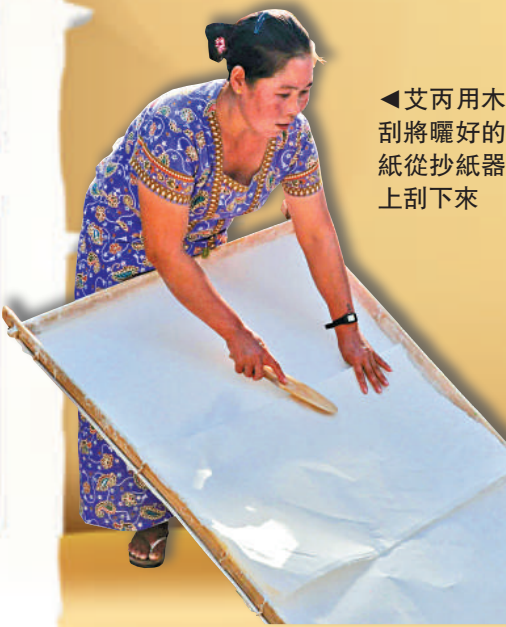
▲艾丙用木刮將曬好的紙從抄紙器上刮下來