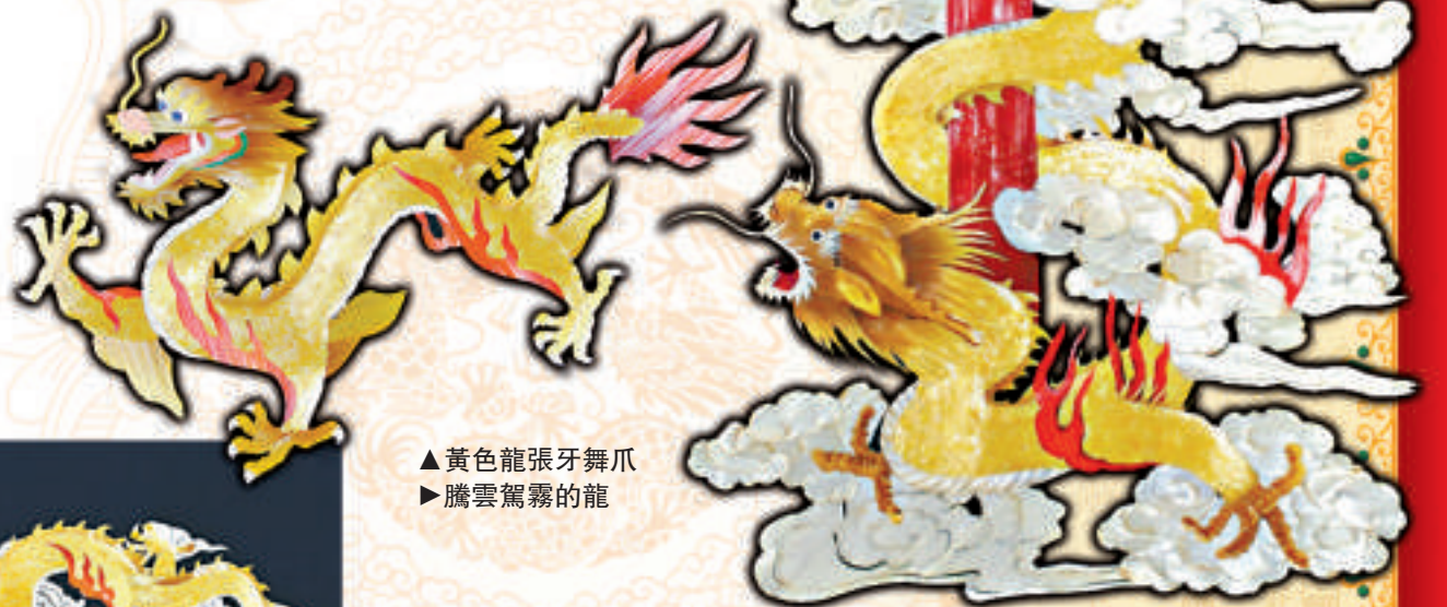
▲黃色龍張牙舞爪 ▶騰雲駕霧的龍