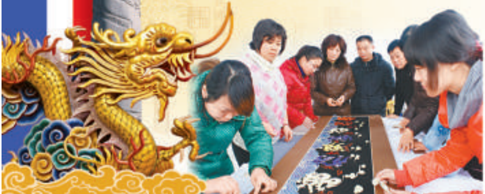
▼下崗女工在工藝師指導下處理作品