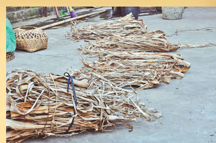
▲作為造紙原料用的「構樹皮」

造紙是中國古代四大發明之一，距今已有兩千多年的歷史，雲南孟定傣族手工造紙技藝迄今傳承了六百多年，仍然在延續使用東漢時期的造紙工藝。 雲南耿馬縣孟定鎮芒團村素有「中華傣家造紙第一村」的美譽，造紙工藝於二〇〇六年被國家文化部列為第一批國家級非物質文化遺產。目前，全組戶戶掌握造紙技藝，常年從事白棉紙生產的有四十八戶，年產白棉紙六十萬張，造紙收入佔村民經濟收入的三分之一。