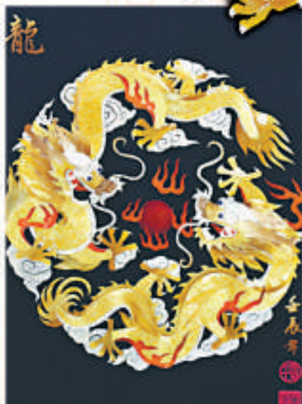
▲黃色版《二龍戲珠》栩栩如生