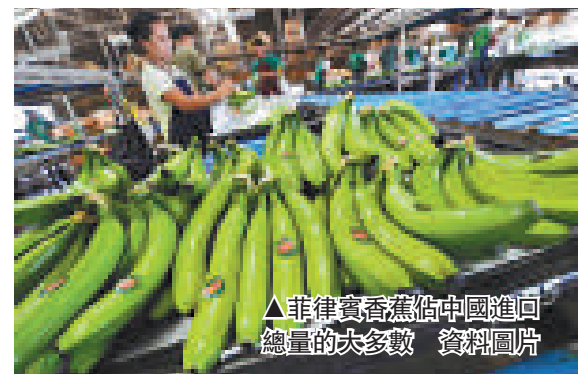
▲菲律賓香蕉佔中國進口總量的大多數 資料圖片

格雷戈里說，出口香蕉與黃岩島事件無關，政府將此看成一個技術問題，這也是為何接下來將派遣一