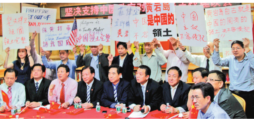
▲美東華僑華人當地時間16日在紐約繼續就黃岩島事件抗議菲律賓的行徑

菲國防部16日聲稱，美國海軍「北卡羅來納」號核動力潛艇停靠菲國蘇比克灣並浮出水面「沒有特別之處」，只是外國艦艇的一次「例行停靠」。