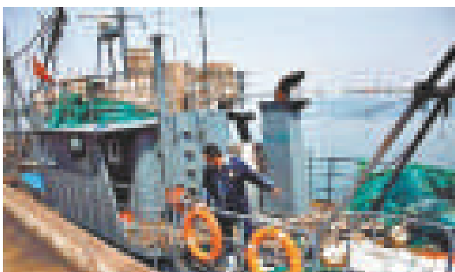
▲15日，「遼丹漁23527」號回到大連漁港

以往，被扣押的幾艘漁船都停泊在大連市金州新區杏樹屯漁港。事發後的漁港只停泊着三四條漁船，顯得很冷清。杏樹屯漁港漁政人員透露，平時漁民在該海域作業時就有一些身份不明人員開着摩托艇攜帶槍支恐嚇作業漁船。