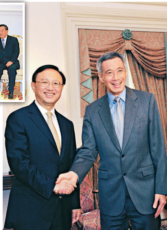
▶外交部長楊潔篪於28日至29日對新加坡進行正式訪問。28日，新加坡總理李顯龍（右）會見中國外交部長楊潔篪