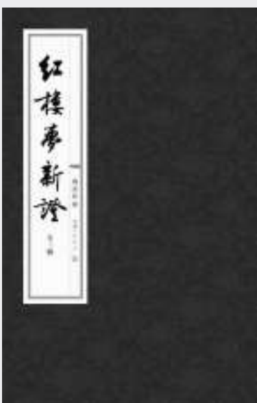
▲周汝昌著作《紅樓夢新證》

此外，周汝昌還主編了《紅樓夢辭典》、《中國當代文化大系·紅學卷》；校訂過新版《三國演義》、《紅樓夢》、《唐宋傳奇選》，並撰序文；為《中國古代文學詞典》、《唐宋詞鑒賞詞典》、《詩詞曲賦名作鑒賞大詞典》、《中國歷代短篇小說選》、《詩詞典故詞典》、《《紅樓夢》世界語版》等撰寫了序文；另有大量學術論文、序跋與專欄文章發表於各地報刊。