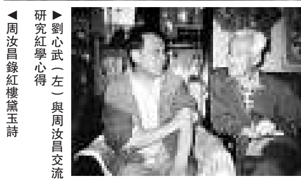
▲劉心武（左）與周汝昌交流研究紅學心得