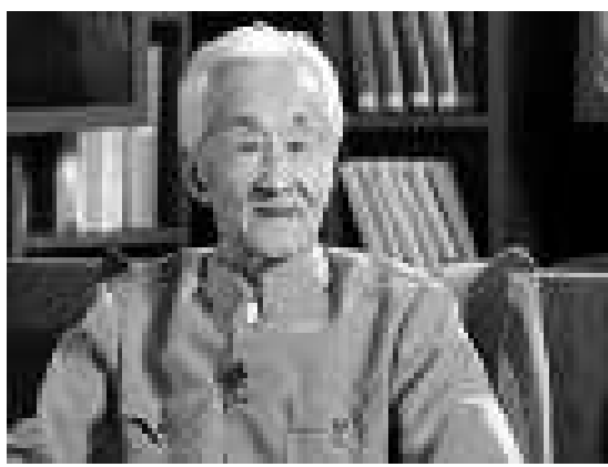
▲周汝昌為央視《百家講壇》講說《紅樓夢》