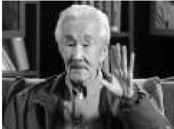
▲周汝昌在央視節目談胡適

周汝昌治學以語言、詩詞理論、中外文翻譯為主，平生耽吟詠、研詩詞、箋註、賞析、理論皆所用心，並兼研紅學。有六十多部學術著作問世，尚有幾部正在印製之中。其中《紅樓夢新證》是第一部、也是代表作。這部著作是紅學研究歷史上里程碑式的著作，是近代紅學研究的奠基之作。