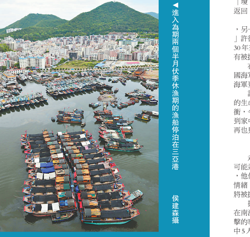
▲ 進入為期兩個半月休漁期的漁船停泊在三港