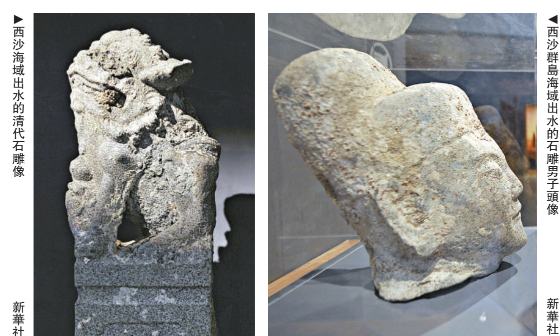
▲ 西沙海域出土的清代石雕像 新華社 ▲ 西沙群島海域出土的石雕男子頭像 新華社