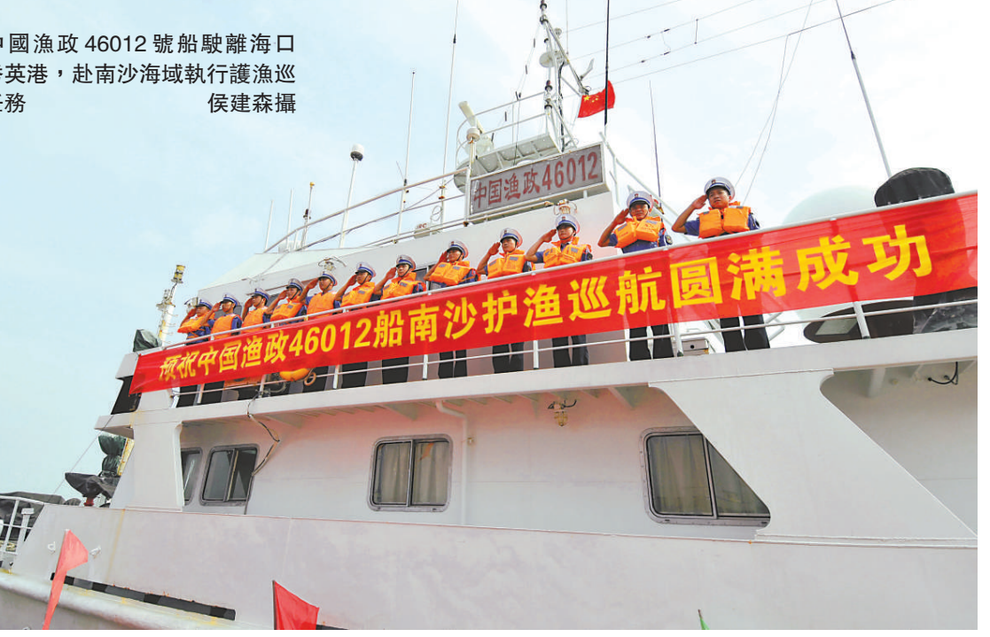
▼ 中國漁政46012號船駛離海口市秀英港，赴南沙海域執行護漁巡航任務