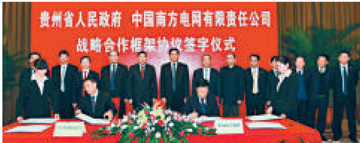
加快轉型，工業強省，推進貴州經濟社會又好又快、更好更快發展

開放、合作、發展、共贏！放眼未來，步履堅實的貴州正向四面八方前所未有地敞開懷抱、發出邀請，貴州與港澳的經濟交流合作將面臨更多的機遇、進入更廣闊的空間。