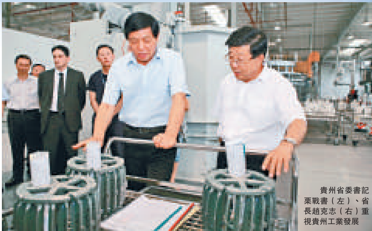
貴州省委書記葉戰書（左）、省長趙克志（右）重視貴州工業發展

茅台酒，黃果樹，遵義會址，儘管有着豐富的資源，迷人的風光，毫無疑問，貴州依舊是一個欠發達省份。如何在「十二五」期間讓貴州擺脫貧困，不僅是貴州思考的，也是國家關心的。今年1月12號，國務院頒布了《關於進一步促進貴州經濟社會又好又快發展的若干意見》，貴州要「後發趕超」。