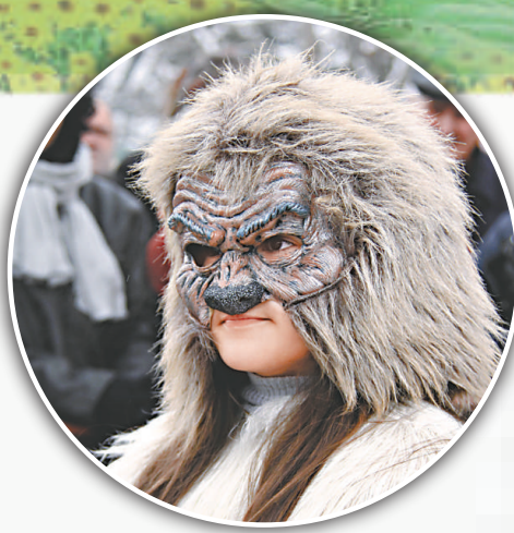
有些面具設計成獸頭，有的做成骷髏，有的做成妖怪，各具特色

面具節源自保加利亞人歡慶一年一度的「蘇爾瓦節」，按俗例，當地人會戴上面具、腰掛銅鈴，以奇異的舞蹈、可怕的面具和震耳欲聾的鈴聲嚇走所有邪魔，迎接春天的到來，並祈求新一年五穀豐收。