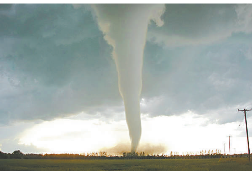
龍捲風的破壞力極大

http://202.55.1.83/news/12/03/02/YM-1456201.htm