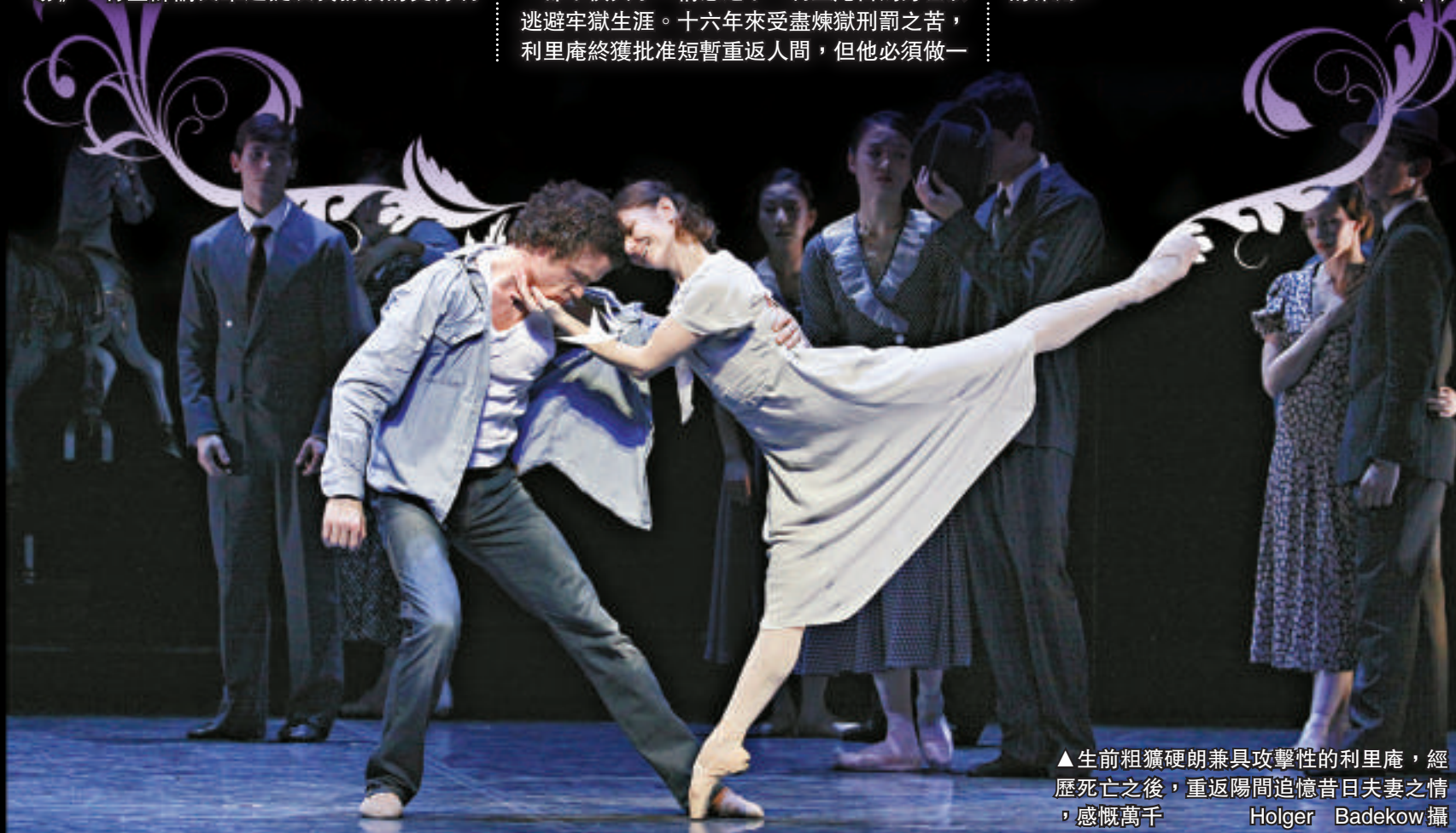
▲生前粗獷硬朗兼具攻擊性的利里庵，經歷死亡之後，重返陽間追憶昔日夫妻之情，感慨萬千

我們舞團擁有優秀的男舞蹈員是眾所周知的事實。在紐邁亞編排的超過一百四十齣舞作中，有無數分量十足的男主角和女主角。在他的舞劇裡，男舞者絕不會只擔當陪襯的作用。(中)