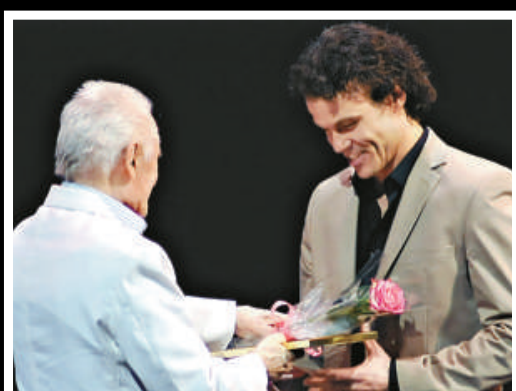
▲卡斯騰·容(右)獲頒莫斯科貝諾瓦芭蕾舞大獎的最佳男舞蹈員獎項