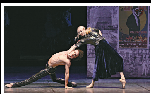
▲《利里庵之再世遊樂場》是漢堡芭蕾舞團的大製作