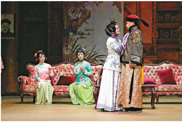
▲《風華絕代》以講述清末奇女子賽金花傳奇經歷為主線 本報攝